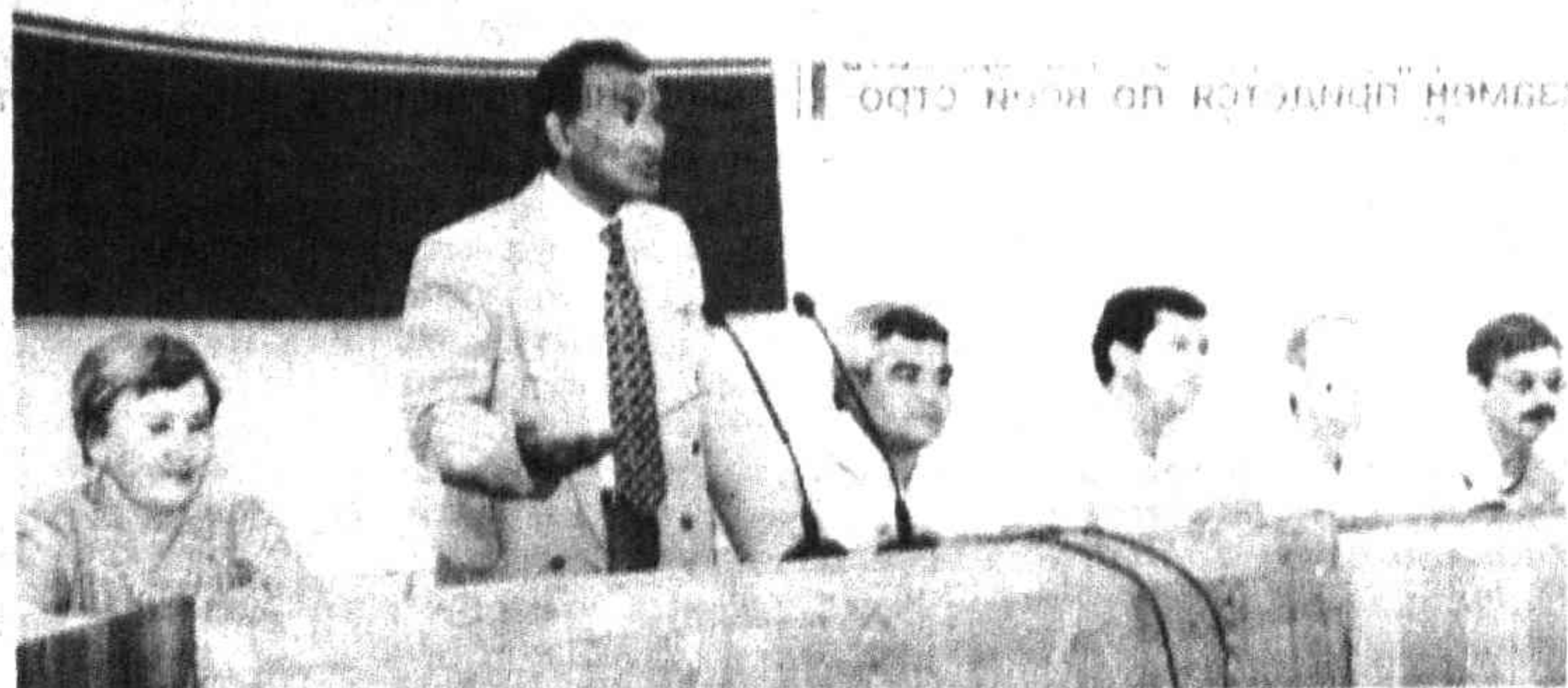
Акция «ТП»: «Лицом к лицу»