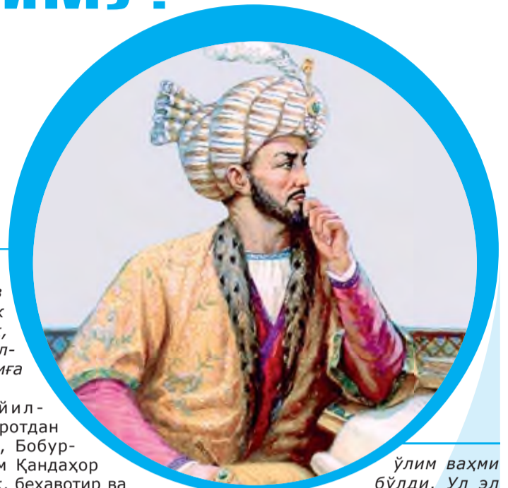
Ўлим ваҳми бўлди. Ул эл тоғдаги ғор ва ко-

Ўша сафарда Бобур Мирзонинг яна бир мардлиги, инсонпарварлиги ва дўстларга садоқат ва мурувватини кўрсатувчи воқеа юз беради. Қўшин минг азоблар билан йўл юриб, уч-тўрт кунда кўтали Заррининг тубига ҳаволи Қутийга етиб келадилар. Қор чопқунлаб ёға бошлади. «Андоқким, борчаға