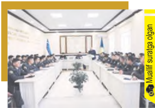
Muallif suratiga olgan

Buyuk shoir va mutafakkir, atoqli davlat va jamoat arbobi Alisher Navoiyning bebaho ijodiy-ilmiiy merosi harbiy xizmatchilarning milliy madaniyati va adabiy-estetik tafakkurini rivojlantirishda alohida o'rin tutadi.