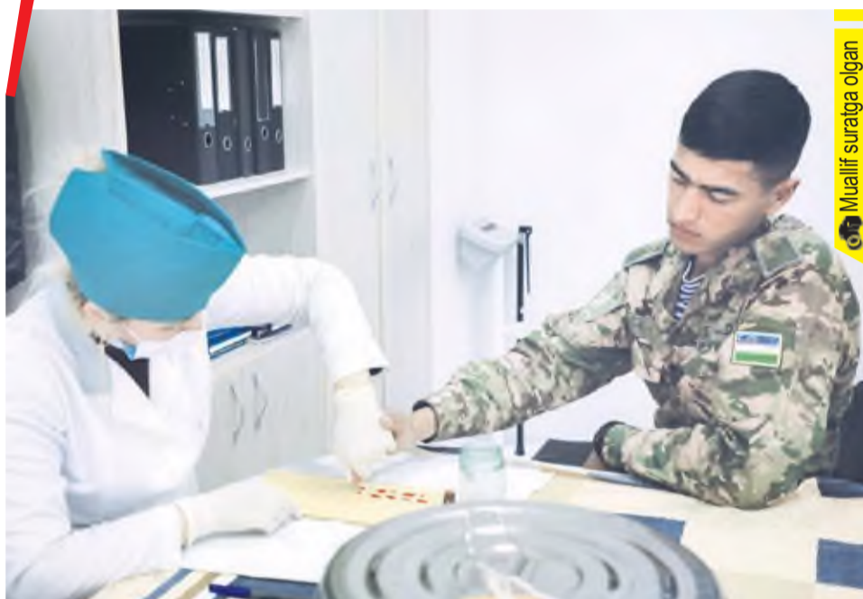
Muallif suraiga olgan

Чирчиқ гарнизонидаги ҳарбий қисмда «Қон донорлиги ҳафталиги» доирасида «Мен донорман» шиори остида бегараз донорлик акцияси ўтказилди.