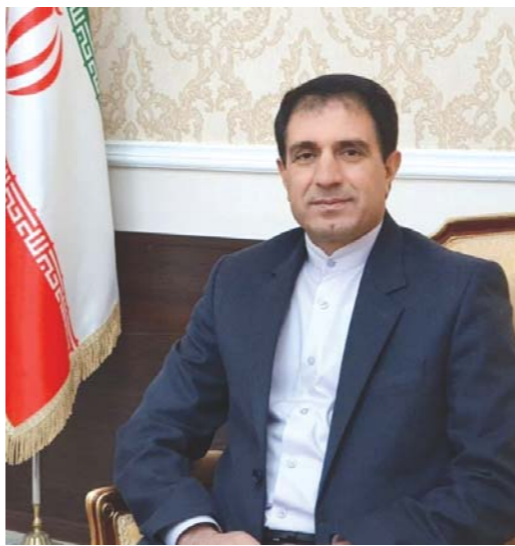
– Оқои сафир, 44-умин солгарди инқилобро Чумхури Исломи ҷи гуна пешво мегирад?

– Бояд бигӯям, ки ин инқилоб воқият мардумӣ буд ва халқро аз истибодоти режими шоханшоҳӣ раҳо кард.