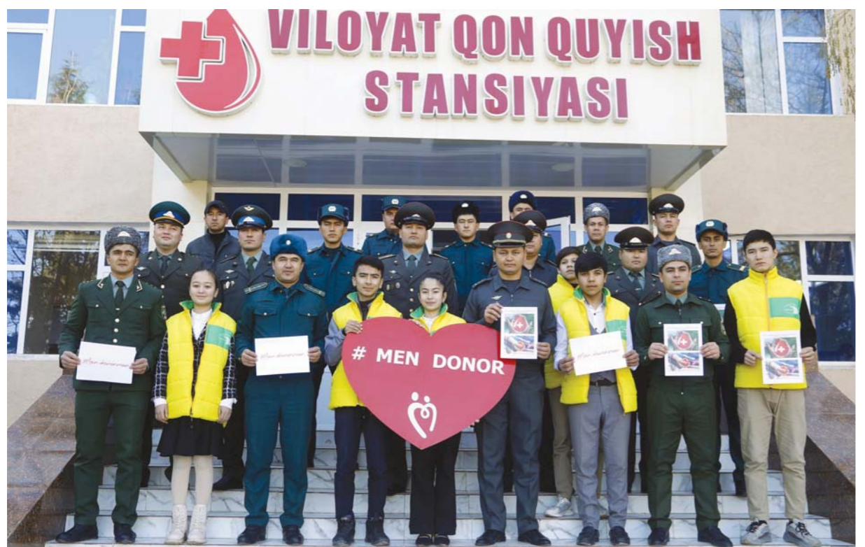
Дар ҳамкорӣ бо Шӯрои Иттифоқи ҷавонони Ўзбекистони вилояти Сурхондарё ва қисмиҳои ҳарбӣ барои муассисаҳои таълими ибтидоӣ идҳои хайрияи «Ман донор ҳастам» гузаронида шуд.

Мусоҳиби Тоҷибой ИКРОМОВ, хабарнигори «Овози тоҷик».