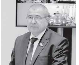
да жойлашган манзиллари учун (Фаргона вилоятининг Сўх тумани, Риштон туманининг "Чўнғара" маҳалла фуқаролар йиғини, шунингдек, Фаргона туманининг Шохимардон, Ёрмон маҳаллалари ва Хосилов маҳалласининг "Таштеша" кишлоқ фуқаролар йиғини) Солиқ кодексида белгиланган солиқ ставкаларидан қатъий назар, солиқ ставкаларини қўлланнинг ўзига хос хусусияти белгиланаётганлиги мазкур қонуннинг яна бир янгилигидир.

Олий Мажлис Сенатининг 26-27 август кунлари бўлиб ўтган ўн саккизинчи ялпи мажлисида маъқулланган "Ўзбекистон Республикасининг Солиқ кодексида ўзгариш ва қўшимчалар киритиш тўғрисида"ги қонун ҳам ана шу мақсадга қаратилгани билан алоҳида эътиборга молик. Қонуннинг аҳамияти ҳақида гап кетганда, аввало, у олиб борилаётган иқтисодий ислохотлар, бюджет жараёнларининг очиқлигини таъминлаш, республиканинг олис хулудларини ривожлантириш ҳамда ёшларни қўллаб-қувватлашга йўналтирилган Президент Фармон ва қарорларидан белгиланган вазифалар ижросини таъминлашга қаратилганлигини таъкидлаш зарур.