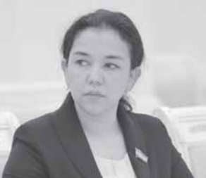
Ўзининг асосий вазифасини, яъни қонун ижодкорлигини амалга ошириш билан бирга, ижро ҳокимияти органлари фаолияти устидан таъсирчан парламент назоратини олиб бориши натижасида Хукуматнинг халқ вакиллари олдидаги масъулияти осиди. Давлат дастурларидан белгиланган вазифаларнинг ўз вақтида ва сифатли бажарилиши устидан назорат кўчатирилди. Депутатлар корпоратив ислохотлар жараёнидаги иштироки сезиларли даражада жонланди.

Депутат, халқ вакили сифатида одамлар орасида кўп юрмиш. Фуқаролар билан бевосита мулоқотда бўлишимиз. Уларни қийнаб келаётган муаммолари, дарду ташвишларини тинглаймиш. Сайловчилар билан учрашувларда уларнинг фикр-мулоҳазаларини эшитиб, юртимизда барча соҳадаги ислохотлар чуқурлашиб, демократик янгиланишлар ўзининг сифат жиҳатидан янги погонасига кўтарилиб бораётгани ҳамда буни халқимиз ўзининг кундалик ҳаётида тўлақонли ҳис қилган ҳолда, эътироф этаяётганига кўп бора гувоҳ бўлмоқдамиз.