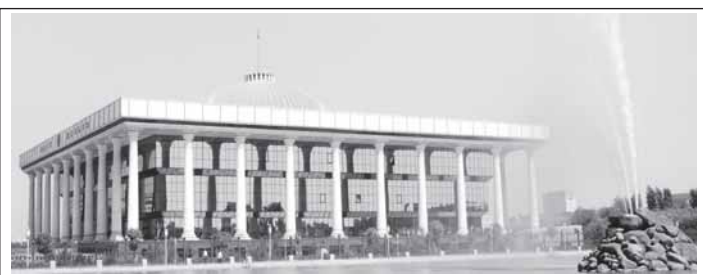
Олий Мажлис Қонунчилик палатасининг Экология ва атроф муҳитни муҳофаза қилиш масалалари қўмитаси ташаббуси билан "Ичимлик суви таъминоти ва оқова сув чиқариш хизмати тўғрисида"ги қонун лойиҳаси муҳокамаси юзасидан фракциялараро дебат ташкил этилди.