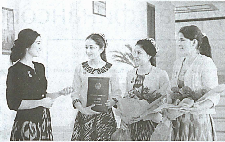
■ В Хорезме создан клуб "Зулфияхоним кизлари".

Об этом шла речь на встрече, в которой приняли участие лауреаты Государственной премии имени Зульфии, писатели и поэты, ученые, специалисты государственных и общественных организаций, СМИ.