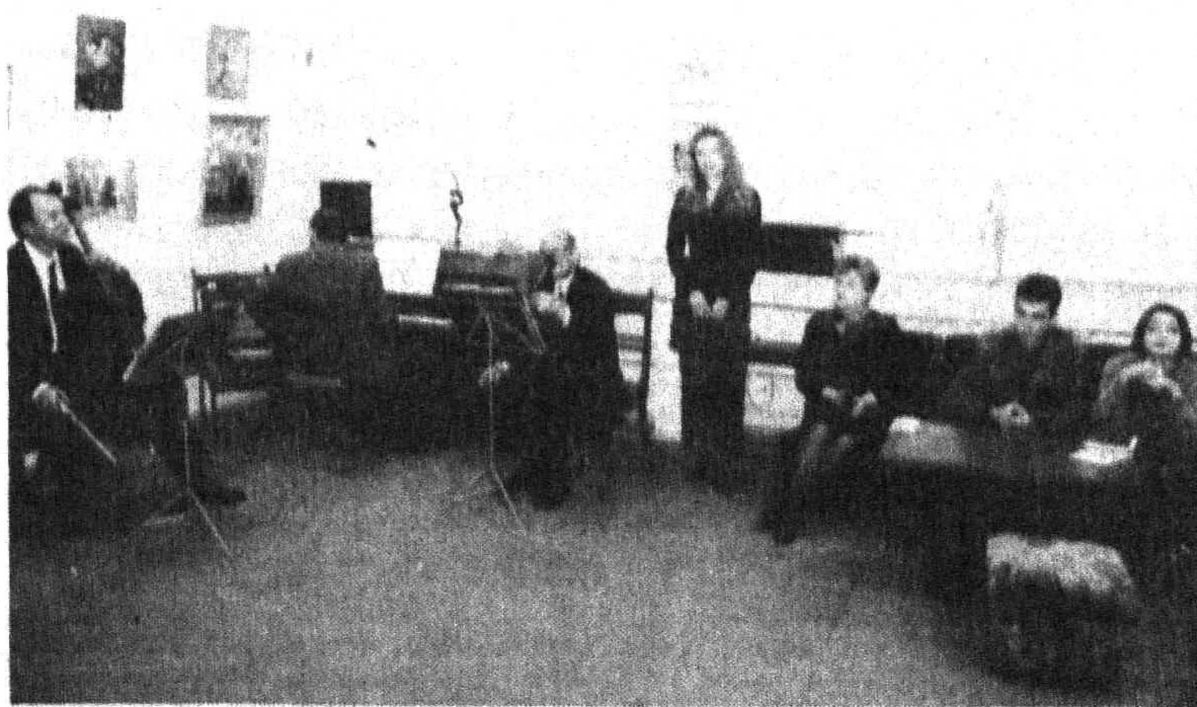
Особенно привлекают вечера в клубе «Здоровье», когда в