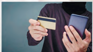
НИКОМУ НЕ СООБЩАЙТЕ КОД СВОЕЙ БАНКОВСКОЙ КАРТЫ!