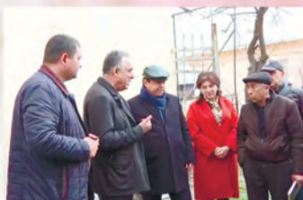
ПРОБЛЕМЫ РЕШАЮТСЯ НА МЕСТЕ