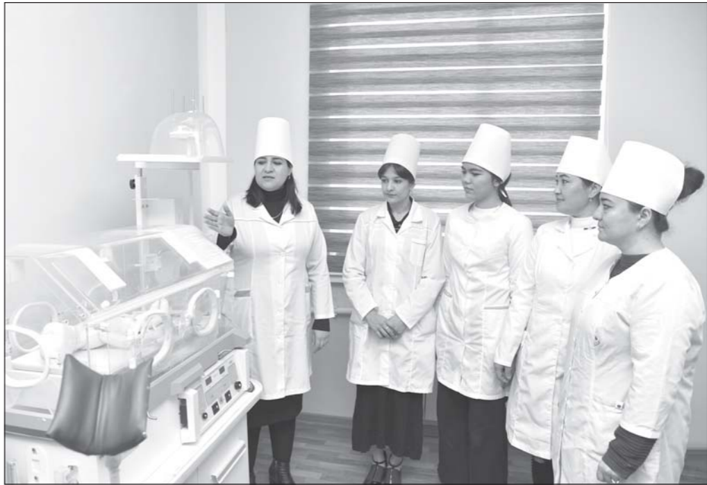
Коллеҷи тиббиёти Зарафшонӣ виллояти Навоӣ 30 сол аст, ки дар самтҳои тайёрикуни ҳамшираҳо, давоқунӣ ва ортопедӣ-стоматологӣ фаъолияти худро пеш мекунанд. Коллеҷи дорои 555 ҷойи буда, баробари ба толибилмон омўзондани доносиш ва таҷрибаҳои тиббӣ, ба мазмуннок гузаронидани вақти фориг аз дарси онҳо низ эътибори алоҳида медиҳанд. Толори варзиш, майдон, хобгоҳ барои 200 нафар, хонаҳои машғулот, лабораторияҳо дар асоси талаби замон таҷҳизонида шудаанд. Маркази захира-аҳборӣ коллеҷи дорои зиёда аз 36 ҳазор китоб буда, ин ҷо ҳар доим бо талабаҳо ғавҷум мебошад. Дар сурат: дар коллеҷи тиббиёти Зарафшон.

Собир ҶОБИРОВ, муаллими мактаби рақами 7-уми ноҳияи Сарисий.