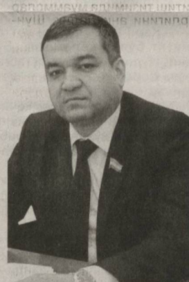
Зафар АБДИРИМОВ, Олий Мажлис Қонунчилик палатаси депутати, «Миллий тикланиш» демократик партияси фракцияси аъзоси

Қонунда соҳани бошқариш, соҳа ходимларининг ваколатлари, ҳуқуқ ва мажбуриятлари, молиялаштиришдан тортиб, уни тасарруф этишгача мувофиқлаштирувчи нормаларнинг белгилаб қўйилиши бу каби салбий ҳолатларнинг келиб чиқишининг олдини олади, албатта.