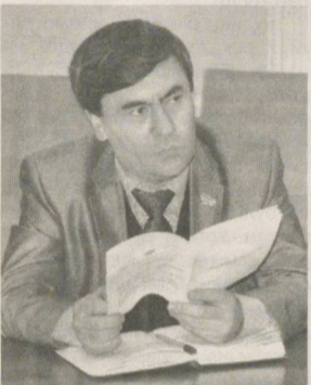
Давомий Боши 1-бетда

МИЛЛИЙ АХБОРОТ МАКОНИНИ РИВОЖЛАНТИРИШГА ХИЗМАТ ҚИЛАДИ ВА БУ ЖАРАЁН ҲАМОНДА ҲИЗМАТ ҚИЛАДИ