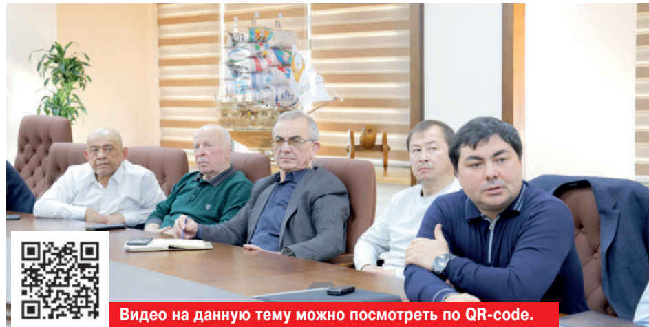
Видео на данную тему можно посмотреть по QR-коде.

То, что Азиатские игры, организация которых в китайском Ханчжоу была запланирована в прошлом году, перенесены на нынешний сезон, разумеется, заставило спортивную общественность республики и соответствующие ведомства и организации внести коррективы в подготовку наших атлетов и сборных по разным видам спорта к главным континентальным соревнованиям, считающимся генеральной репетицией перед всемирным смотром четырехлетия - Олимпиадой-2024 в Париже (Франция). Однако изменение сроков старта Асиады не изменило общей стратегии и тактики, определенной в постановлении Президента «О комплексной подготовке спортсменов Узбекистана к XIX летним Азиатским и IV Парасиатским играм, проводимым в городе Ханчжоу (Китай) в 2022 году» от 5 мая 2022-го.