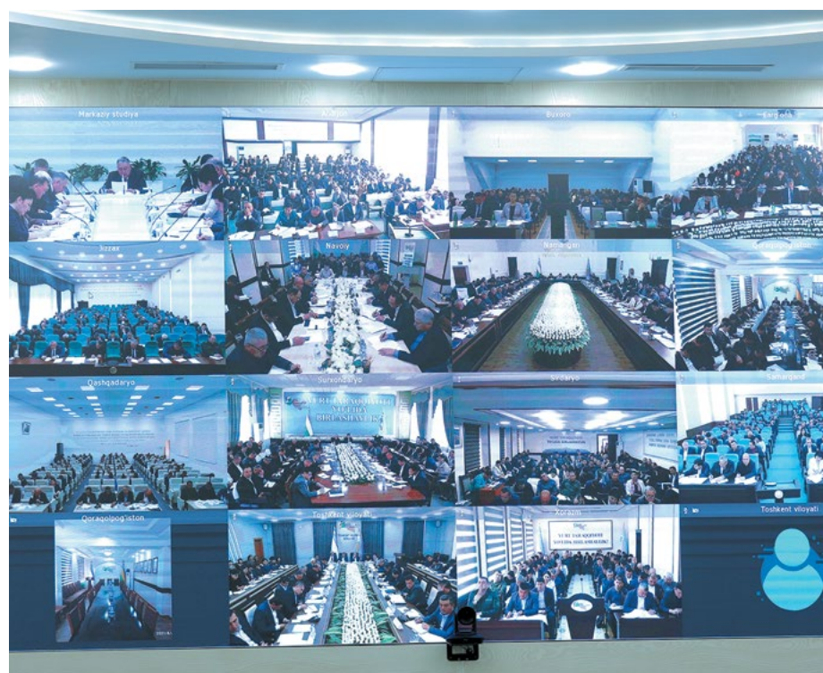
Саломат Абдураҳмонов орадан суратлар

Жорий мавсумда болаларни оромгоҳларга қамраб олиш даражасини кўтаришдек муҳим вазифа ҳам турибди. Шу билан бирга, сифатли тиббий хизмат ташкил қилинади, санитария-гигиена талабларига риоя этилишига алоҳида эъти-