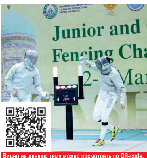
Видео на данную тему можно посмотреть по QR-коде.

«Правда Востока» уже сообщала, что в эти дни на стадионах Ташкента и Ферганы стартовал розыгрыш Кубка Азии среди 20-летних футболистов, вошедших в составы 16 лучших команд континента после отборочных турниров. Состоялись матчи первого тура в борьбе за почетный трофей.