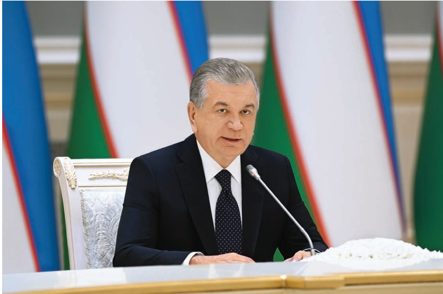
Президент Республики Узбекистан Шавкат Мирзиёев 6 марта провел встречу с депутатами Законодательной палаты и членами Сената Олий Мажлиса, руководством Верховного суда.

На мероприятии состоялись консультации по итогам изучения поступивших от нашего народа предложений по внесению изменений и дополнений в Конституцию.