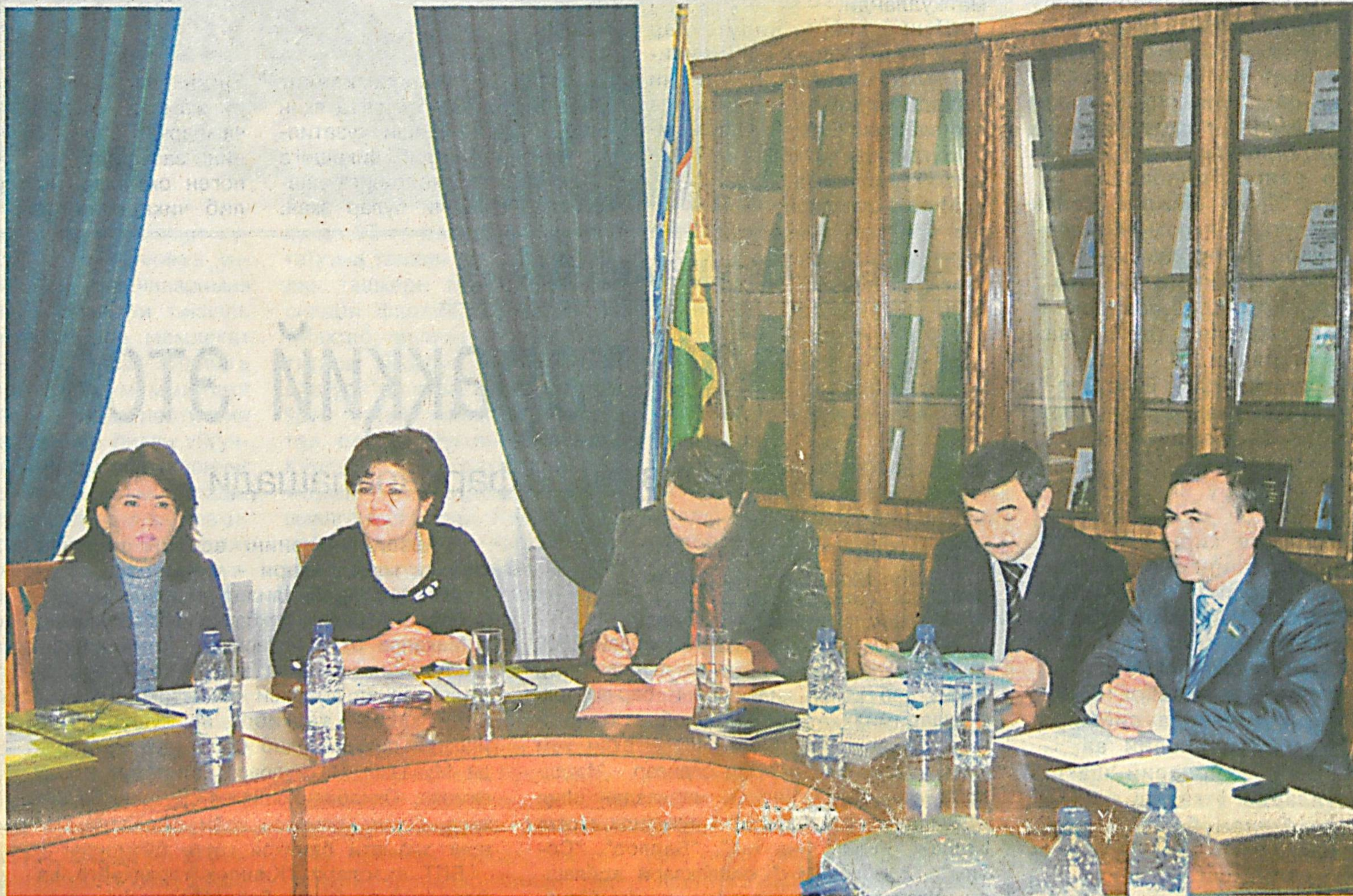
Семинар-ўқув машғулотларидан лавҳа