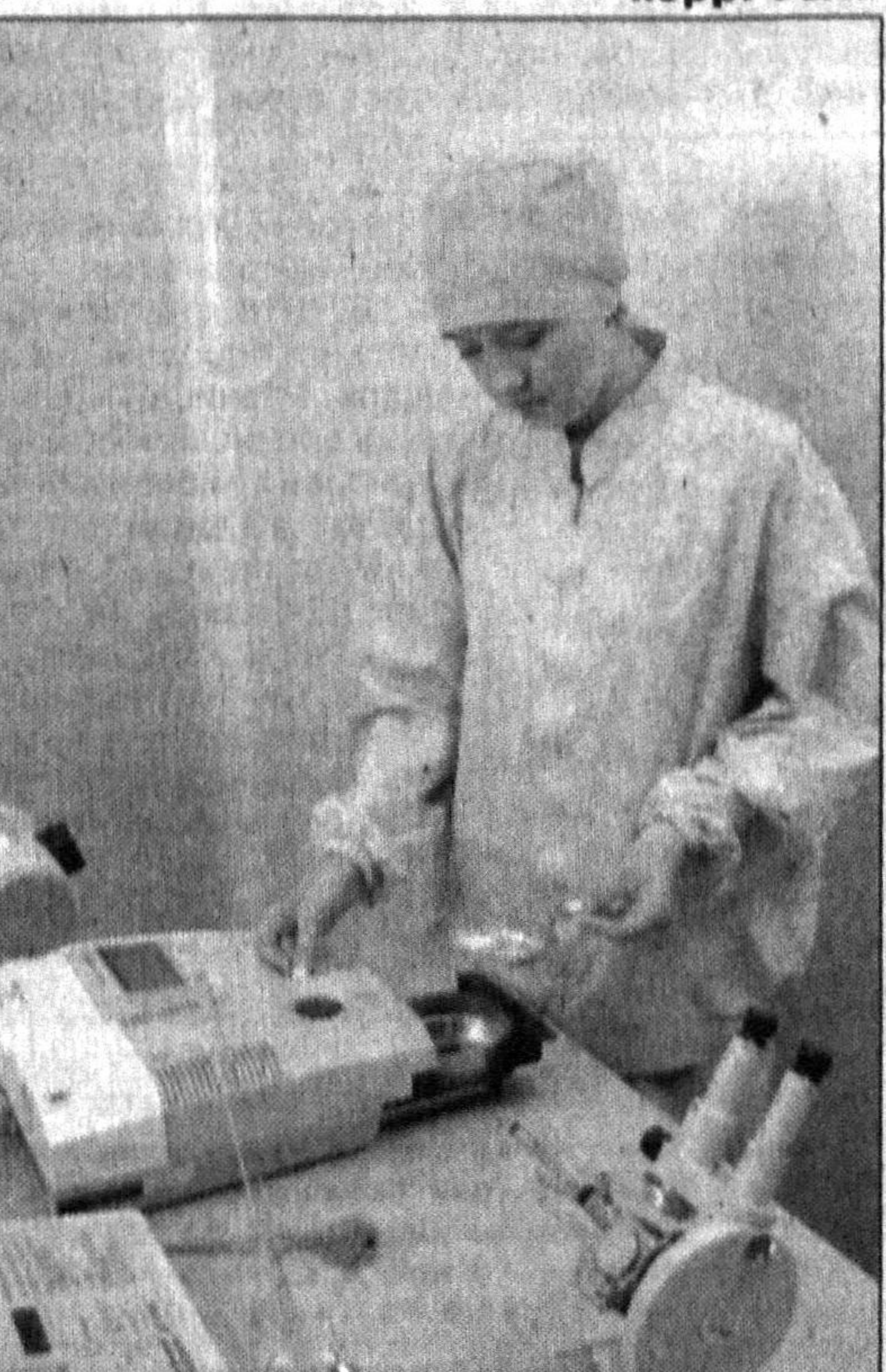
На снимках: моменты работы в государственно-акционерном концерне «Узфармсанонат».

Увеличение видов продукции, соответствующей международным стандартам, повышение ее качества позволяют