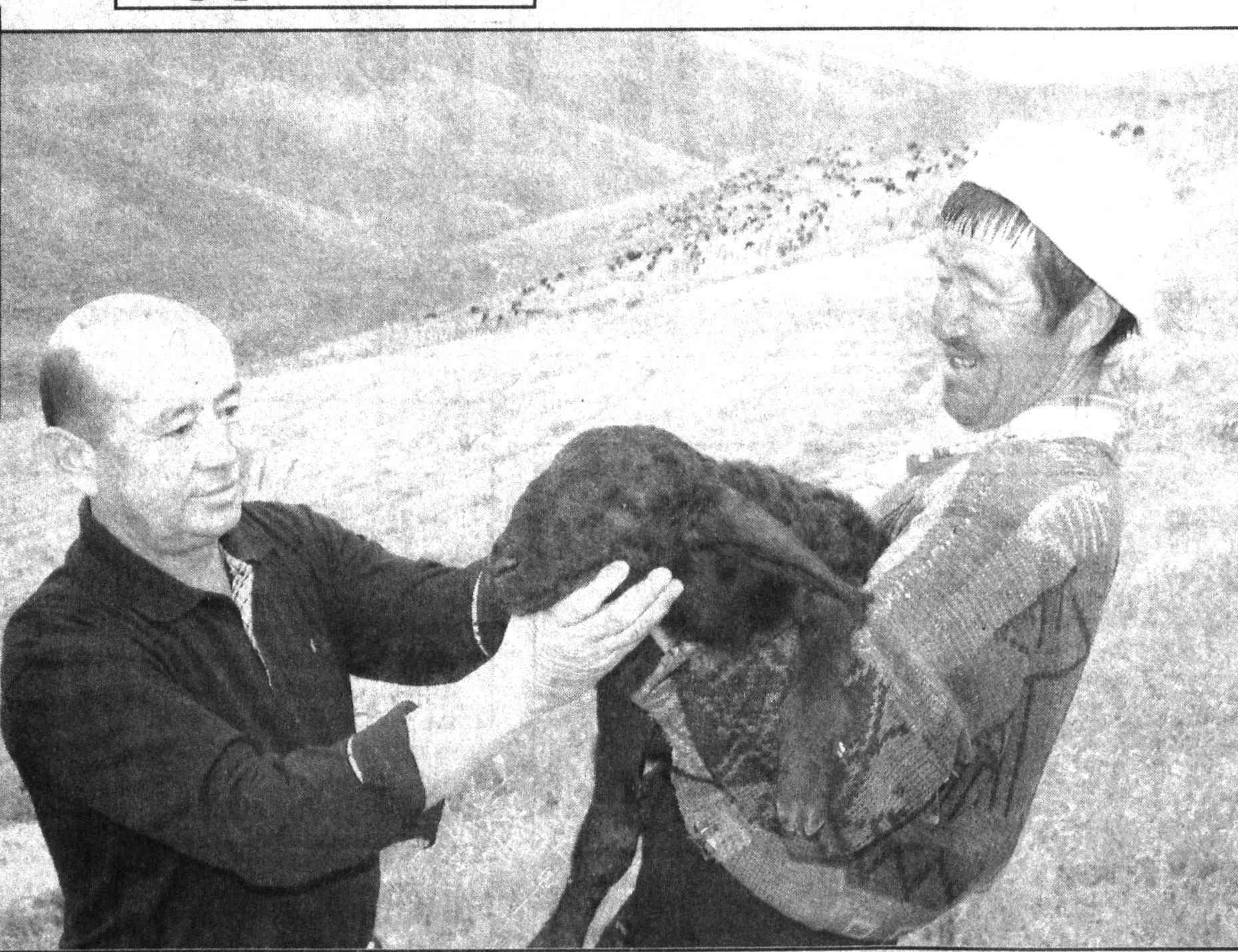
О коровах, баранах, лошадях и других парнокопытных он знает практически все, с увлечением рассказывает о рационе и кормах, возможных буренкиных болезнях и надеях.