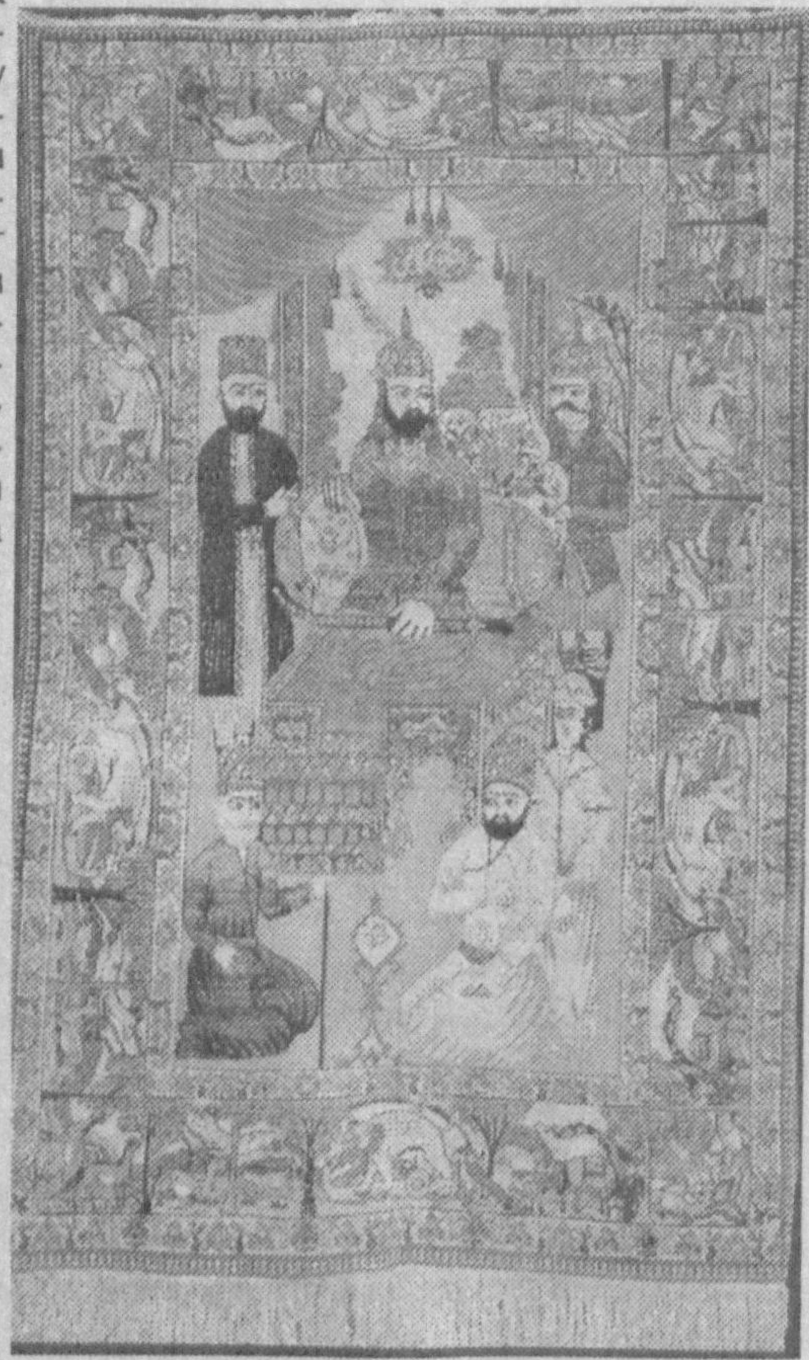
Суратда: Амир Темур сиймоси туширилган гилам

лаб берди. Унинг айтишича, Соҳибқирон Амир Темур ҳазратлари Ироқни фатҳ этиш жараёнида Басрага етиб келган, бу шаҳарнинг бир қатор машойихлари унга пешвоз чиқишди ва Басра ҳам муқаддас шахар ҳисобланиб, бунда Юнус пайгамбар ва Каъбатуллоҳнинг бунёд этилишида катта хизмат кўрсатган Шийс ҳазратлари дафн этилганлигидан Соҳибқиронни оғоҳ этишди. Шунда Амир Темур бу ша-