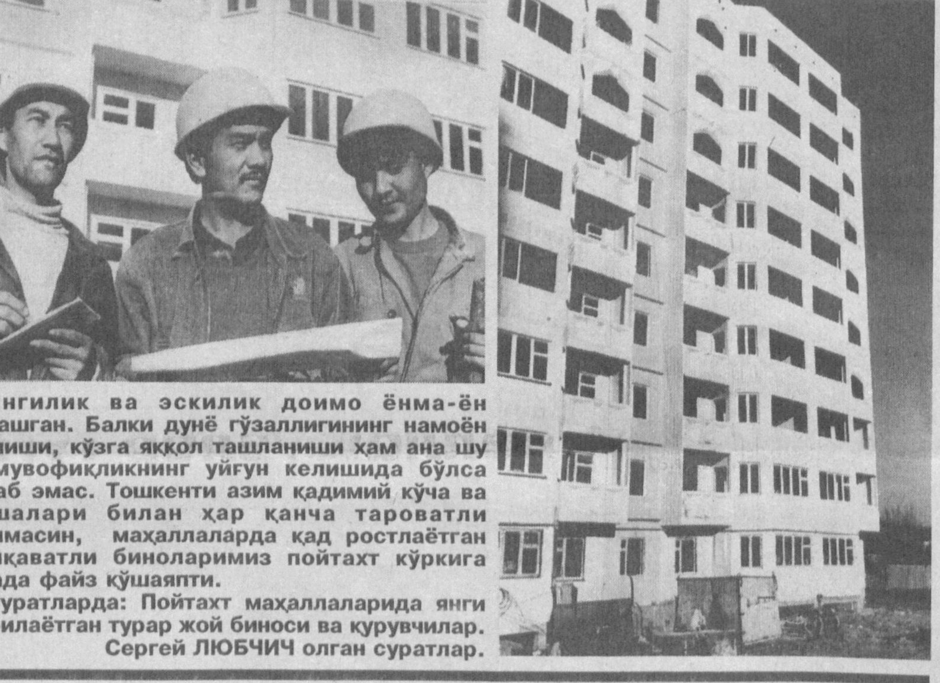
Янгилик ва эскилик доимо ёнма-ён яшашган. Балки дунё гўзаллигининг намоян бўлиши, кўзга аққол ташланиши ҳам ана шу номувофиқликнинг уйғун келишида бўлса ажаб эмас. Тошкенти азим қадимий кўча ва гўшалари билан ҳар қанча тараватли бўлмасин, маҳаллаларда қад ростлаётган қўпқаватли биноларимиз пойтахт кўригига анада фазиз қўшапти.

Суратларда: Пойтахт маҳаллаларида янги қурилаётган турар жой биноси ва қурувчилар.