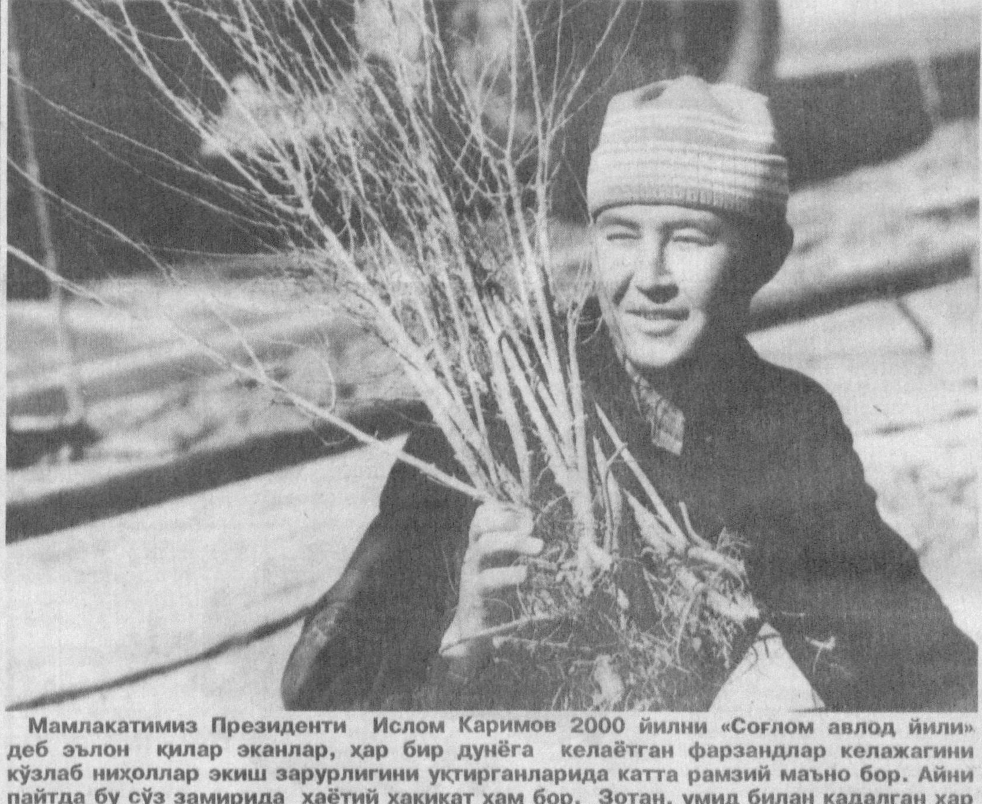
Мамлакатимиз Президенти Ислом Каримов 2000 йилни «Соғлом авлод йили» деб эълон қилар эканлар, ҳар бир дунёга келаётган фарзандлар келажакни кўзлаб ниҳоллар экиш зарурлигини ўқтирганларида катта рамзий маъно бор. Айни пайтда бу сўз замирида ҳаётини ҳақиқат ҳам бор. Зотан, умид билан қадагдан ҳар бир ниҳол авлод соғломлиги учун хизмат қилади.