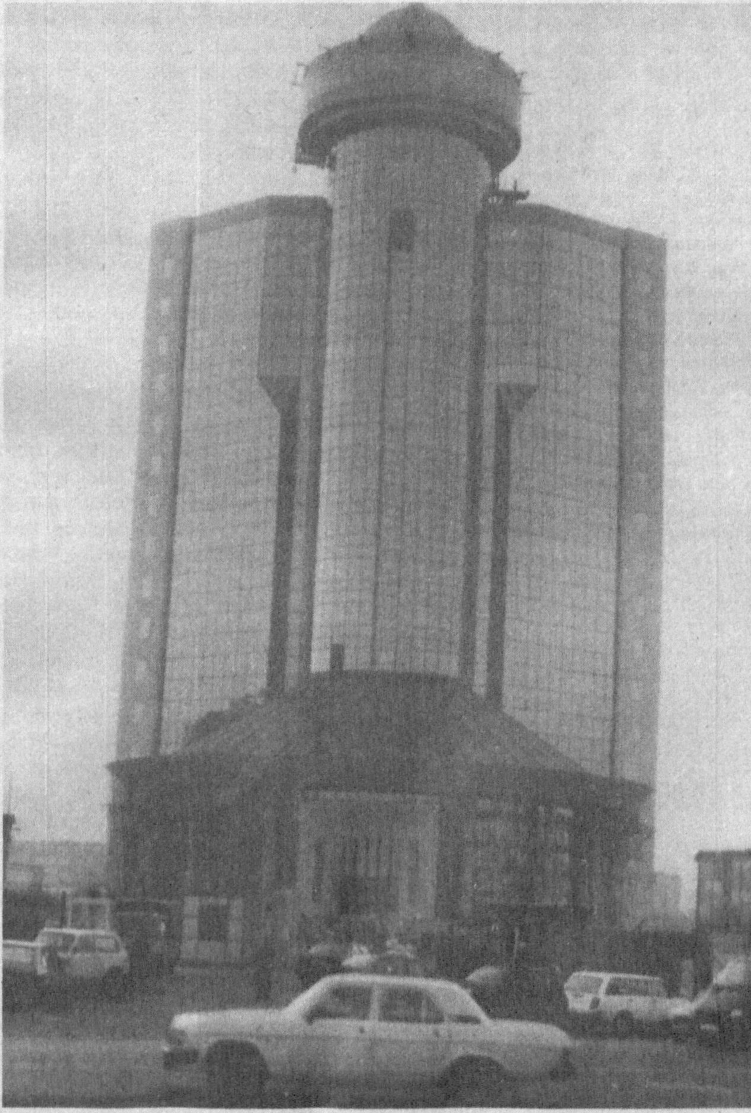
Пойтахтимизда қад ростлаган янги банк биноси.