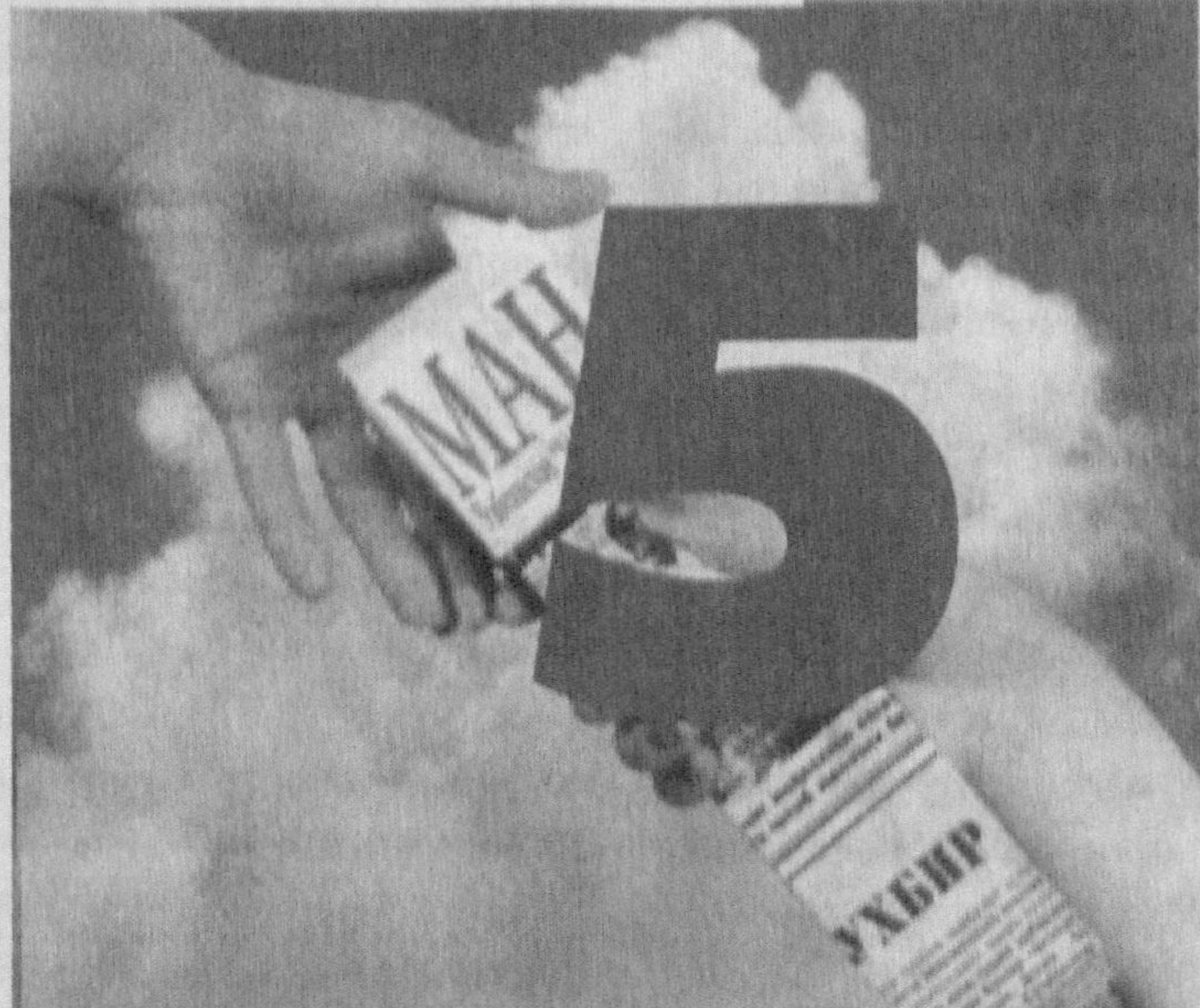
Ҳа, «Маҳалла» 5 ёшга тўлди. 1996 йил мана шу кунларда унинг ilk сони юз кўрсатганди. Газетанинг босиб

Кўнгилли тадбирларини кўнгилли тадбирларга улаш асли халқимизга хос ҳислат. Шундан бўлса керак, халқимиз азалдан тўй бошласа, бир неча кунлаб кети узилмаган, тўйлар тўйларга уланган, элга қирик кун қўша-қўша дошқозонларда ош берганлар ҳам ўша ўзбекнинг ажлодлари. Буни қарангки, Оллоҳнинг халқимизнинг ҳислатига хос меҳр-муруватини, юртимизда байрамлар, шоднаёллар ҳам бир-бирига улашиб кетмоқда. Яратганини инояти билан бир-бирини «Тўйдан бошинг чиқмасин» деб алқағувчи халқимизнинг бошида қўша-қўша байрамлар. Барча мусулмонлар қатори Оллоҳ буюрган фарз - рўзан рамазон ойида рўза тутиб, Йиди рамазон ҳайитидек муқаддас шоднаёлдан баҳри дили ййраган халқимиз - мусулмон биродарларининг қувончли онлари Янги йил тадбирлари билан боғланиб кетди. «Маҳалла» газетаси жамоаси юрдошларимизнинг бу каби қувончларини газета саҳифаларида ёритар экан, ўз қалбларидида қувончу хайратларини ҳам муштарийлар билан баҳам кўргиси келади, албатта. Йиди рамазон ҳайити, Янги йил тантаналарининг хуш кайфиятлари ҳали кўнгилда хира тортмасидан туриб «Маҳалла»нинг 5 ёшга тўлишидан қалбларимиз янада равшан тортиди.