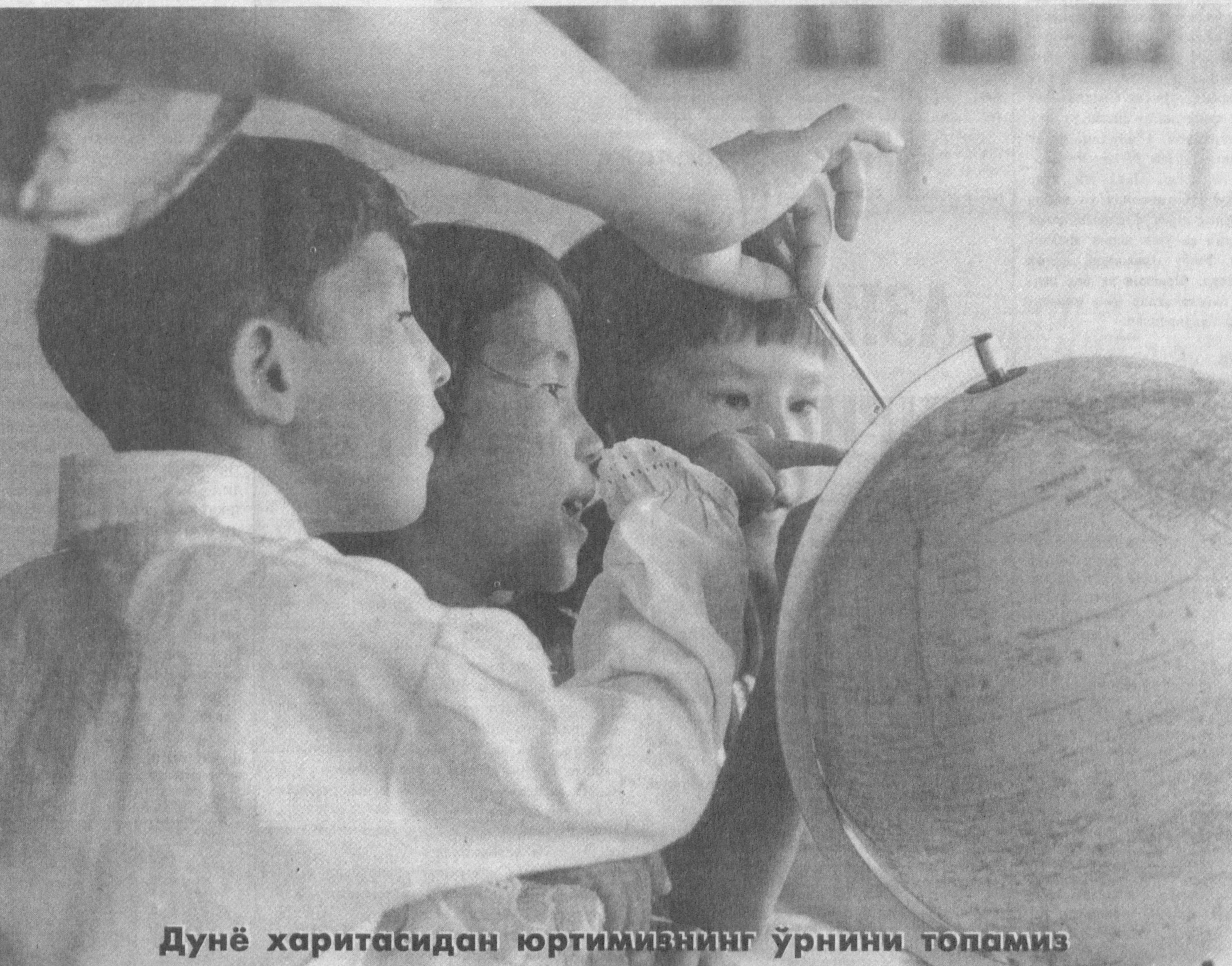
Дунё харитасидан юртимизнинг ўрнини топамиз