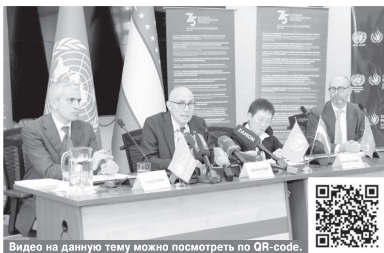
Видео на данную тему можно посмотреть по QR-коде.

Мы знаем, что сильное гражданское общество является жизненно важным звеном в системе защиты прав человека, - сказал Верховный комиссар. - Крайне важно, чтобы неправительственные организации могли работать