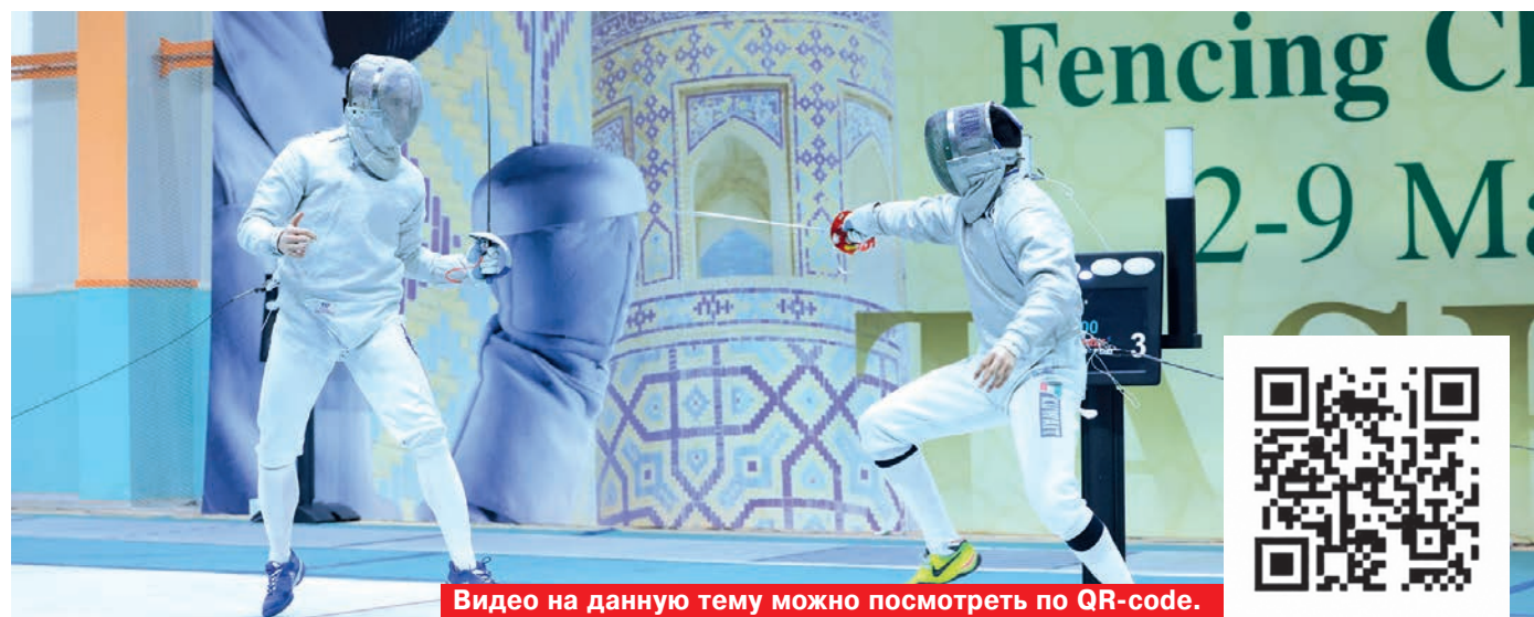
Видео на данную тему можно посмотреть по QR-code.