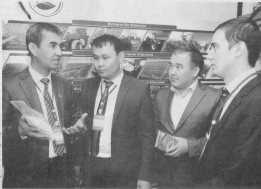
Солиқ 30НР олган суратлар