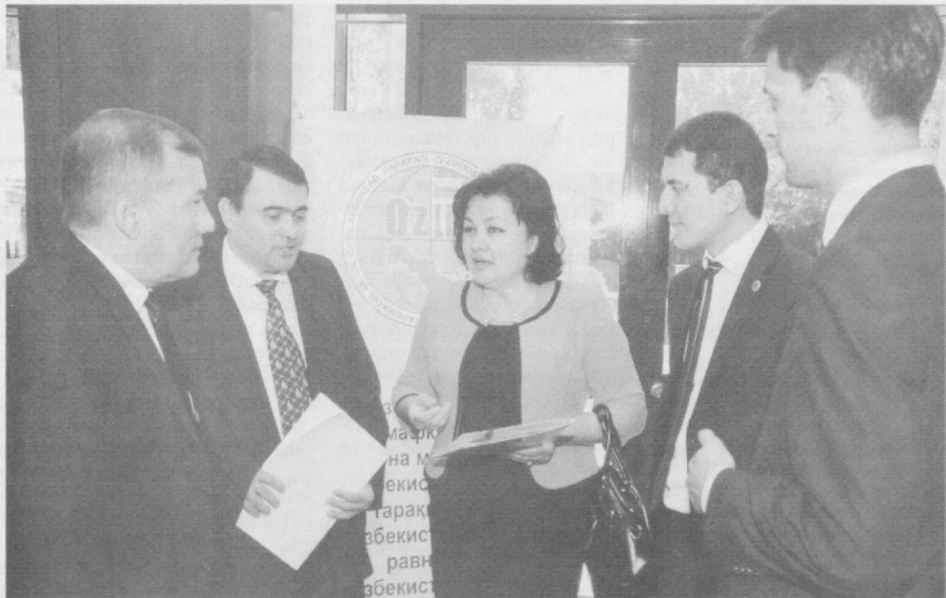
Давоми. Бошланиши 1-саҳифада

Озиқ-овқат хавфсизлигини таъминлашга кўмаклашиш мақсадида барча ҳудудларда озиқ-овқат маҳсулотларини етиштириш, қайта ишлаш ва экспорт қилиш бўйича истиқболли лойиҳаларни амалга ошириш учун туман ва шаҳар партия ташкилотлари, ҳалқ депутатлари маҳаллий кенгашларидаги О'зЛиДеР депутатлари томонидан 2015 йилда 1 минг 344 та инвестиция лойиҳаси ҳамда 21,5 минг кўп тармоқли фермер хўжалиқларида янги интенсиф боғлар, узумзорларни, хизмат кўрсатиш марказлари ва қишлоқ хўжалиги маҳсулотларини қайта ишлаш бўйича корхоналарини ташкил этиш лойиҳалари ижроси юзасидан жамоатчилик ва депутатлик назорати олиб борилди. "Мулкдор оила" лойиҳаси доирасида 1000 га яқин иштирокчининг бизнес-режалари молиялаштиришга лойиҳа деб топилди, 420 нафар қатнашчи қарийб 11 миллиард сўмлик имтиёзли кредит маблағлари ажратилди. Натيجида 1900 та янги ва кўшимча иш ўринлари яратилди. Шунингдек, Ўзбекистон Фермерлари кенгаши билан ҳамкорликда ёшларни тадбиркорликка кенг жалб қилиш, уларнинг иқтисодий-сиёсий билимларини, интеллектуал салоҳиятини юксалтиришга қаратилган қатор лойиҳалар амалга оширилмоқда. Қишлоқ хўжалиги йўналишида мутахассислар тайёрловчи олий таълим муассасалари талабалари ўртасида "Келажак фермери" танлови ташкил этилди. Унинг якунларида кўра, 12 нафар талаба О'зЛиДеР ва Фермерлар кенгашининг стипендияси, 17 нафари эса қимматбаҳо муқофотларга сазовор бўлди. 2015 йилнинг 26-27 ноябрь кунлари илк бор Қашқадарё вилоятида О'зЛиДеР Сиёсий Кенгаши Ижроия