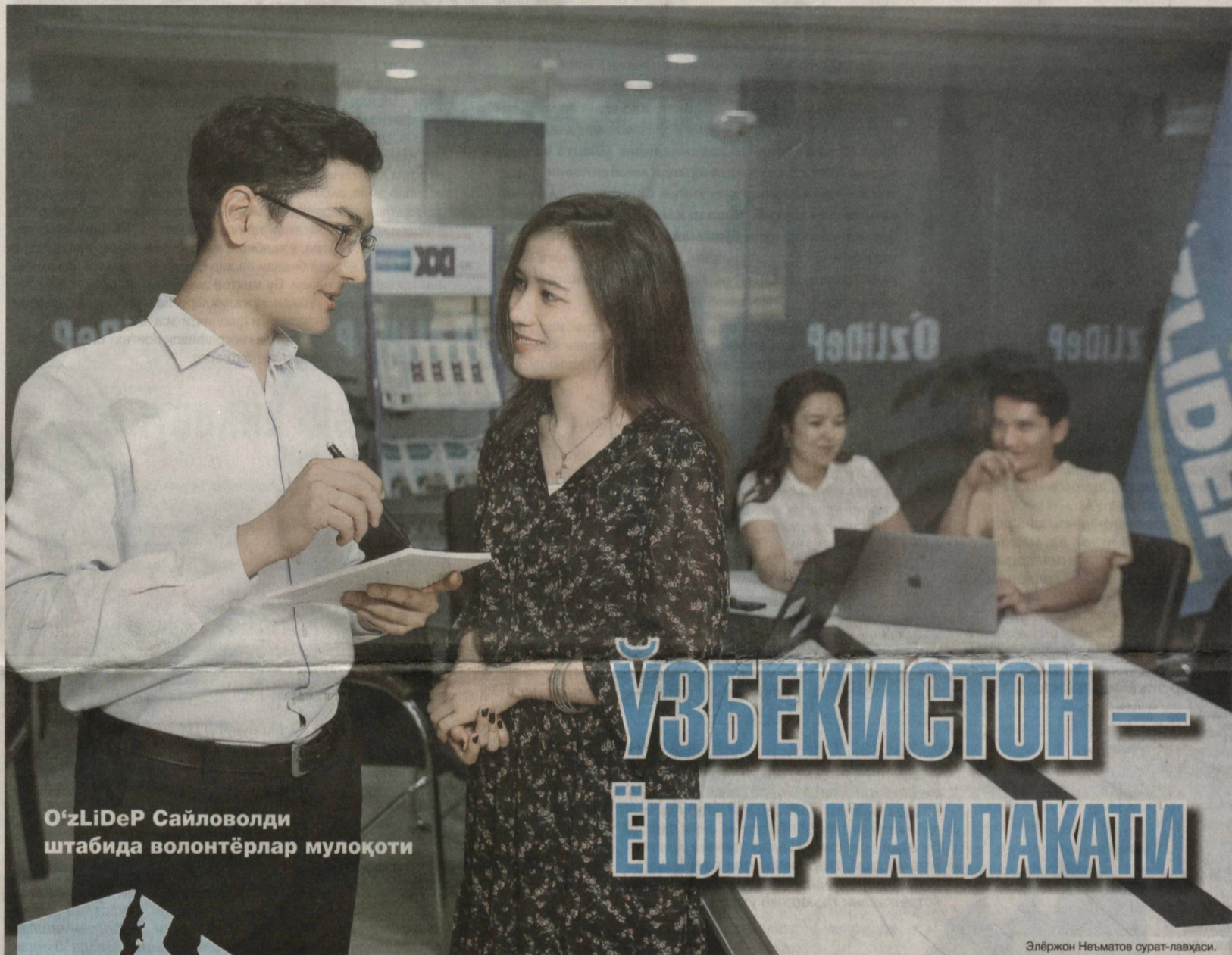
O'zLiDeP Сайловолди штабида волонтерлар мулоқоти