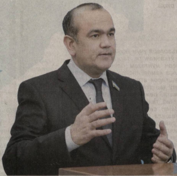
Нодир ЖУМАЕВ, Олий Мажлис Қонунчилик палатаси депутати:

– Ортиқча ваҳимага берилиш, истеъмождан ортиқ озиқ-овқат маҳсулотларини ғамлаш, тартибсиз харидларни амалга ошириш ўтган бир йилдан зиёд давр мобайнида қандай оқибатларга олиб келганининг гувоҳи бўлдик. Дўконлардаги бўш расталар, айрим дори воситалари нархи кескин ошиб кетиши ёдингиздами?