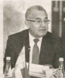
Акмал САИДОВ, Ўзбекистон Республикаси Олий Мажлиси Қонунчилик палатаси Спикери биринчи ўринбосари:

тириш ва молиявий қўллаб-қувватлаш бўйича амалий ёрдамлар берилди”. Энди ривожланаётган иқтисодиётга жиддий зарба берган пандемия шароитида юқорида келтириб ўтилган амалий ишлар осонлик билан қилинган эмас. Бу рақамларнинг тағида жуда катта меҳнат ва матонат ётишини ҳаммамиз теран англашимиз лозим, деб биламан. Давлатимиз раҳбари Мурожаатномасида алоҳида таъкидлаб ўтганидек, “Халқимизнинг буқилмас иродаси, фидокорона меҳнати ва матонати, аҳоли ва давлат органларининг биргаликдаги саъй-ҳаракатлари туғайли мавжуд қийинчиликларни мардона энгиб ўтмоқдими?”. Фурсатдан фойдаланиб, бугун судьяларимиз олдида турган энг муҳим вазифалар ҳақида ҳам қисқача тўхталиб ўтмоқчиман. Ўзбекистонимиз тараққиётидаги туб бурилиш палласида инсон ҳуқуқи ва эркинликларини, уларнинг қонуний манфаатларини таъминлашда судья ва суд тизими ходимлари ўзларининг фаолиятига ниҳоятда масъулият билан ёндашиши талаб этилади. Унутмангки, сизлар томонингиздан қабул қилинаётган қарорлар нафақат инсон тақдирини билан, балки давлат ва жамият тараққиёти тақдирини билан чамбарчас боғлиқдир. Барча судья ва суд тизими ходимларининг онгу шууридан Президентимизнинг “энди таъмағирлик қилган судья, сиёсатга, мамлакат Президентига ва халқига хиёнат қилган деб баҳоланади”, деган гаплари мустақкам ўрин олиши шарт.