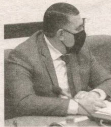
Шерзод АБДИҚОДИРОВ, Судьялар олий кенгаши аъзоси, юридик фанлар доктори:

“Судьялар клуби” телекўрсатуви ташкил этилади ва унда суд-ҳуқуқ соҳасига оид долзарб мавзуларда сўхбат, баҳс ва мунозаралар эфирга берилади ҳамда суд фахрийлари ва ибратли судьялар фаолияти, ҳаёти билан кенг жамоатчилик таништириб борилади.