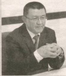
Холмўмин ЁДГОРОВ, Судьялар олий кенгаши раиси:

Мазкур Фармоннинг ижросини таъминлаш мақсадида 2021 йил 18 январь кунини Судьялар олий кенгашида Судьялар клуби ташкил этилди ва унинг тақдироти бўйича ўтди.