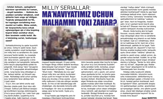
MILLIY SERIALLAR: MA'NAVIYATIMIZ UCHUN MALHAMMI YOKI ZAHAR?

"Hijron" nomli o'zbek seriali berilayotgan ekan, erinmay bir hafta tomosha qildim. Mazmuniga ko'ra, undagi 4-5 nafar dugona ikkinchi xotin emish, yana ularning ersiz dugonalari shu ikkinchi xotin bo'lgan dugonalarning erlarini