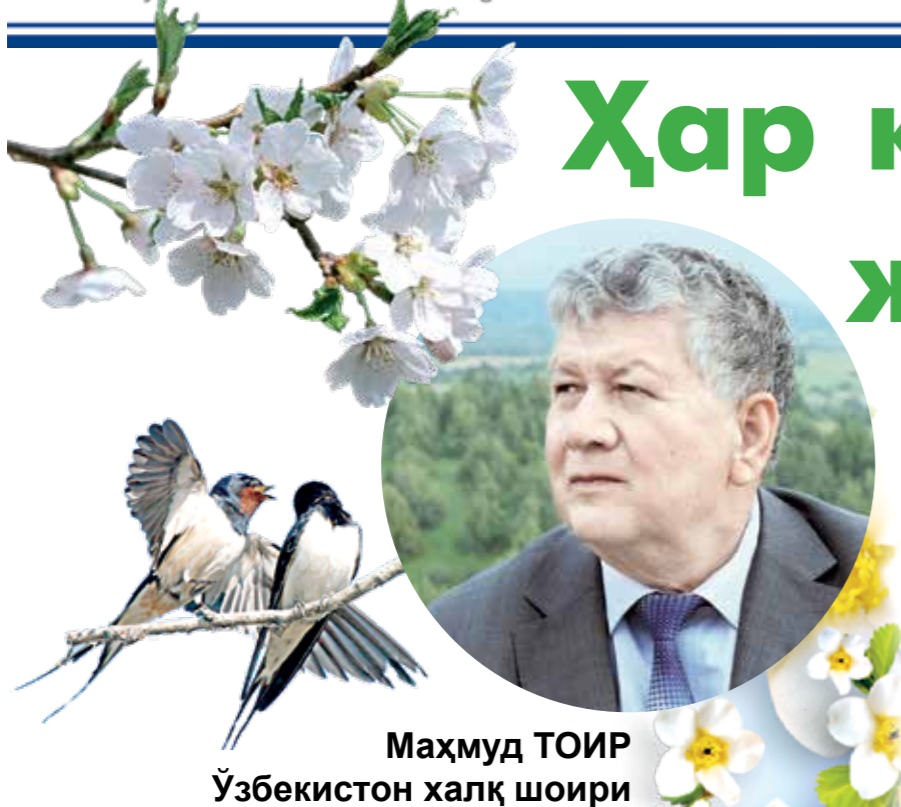
Махмуд ТОИР Ўзбекистон халқ шоири