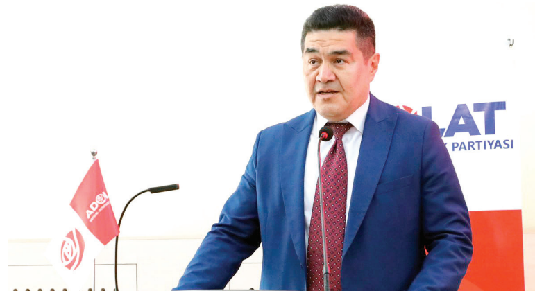
Фазлитдин ЗИЯЕВ, «Адолат» СДП Сийёсий Кенгаши Марказий аппарати бошқарма бошлиғи, Тошкент шаҳар кенгаши раиси в.б.