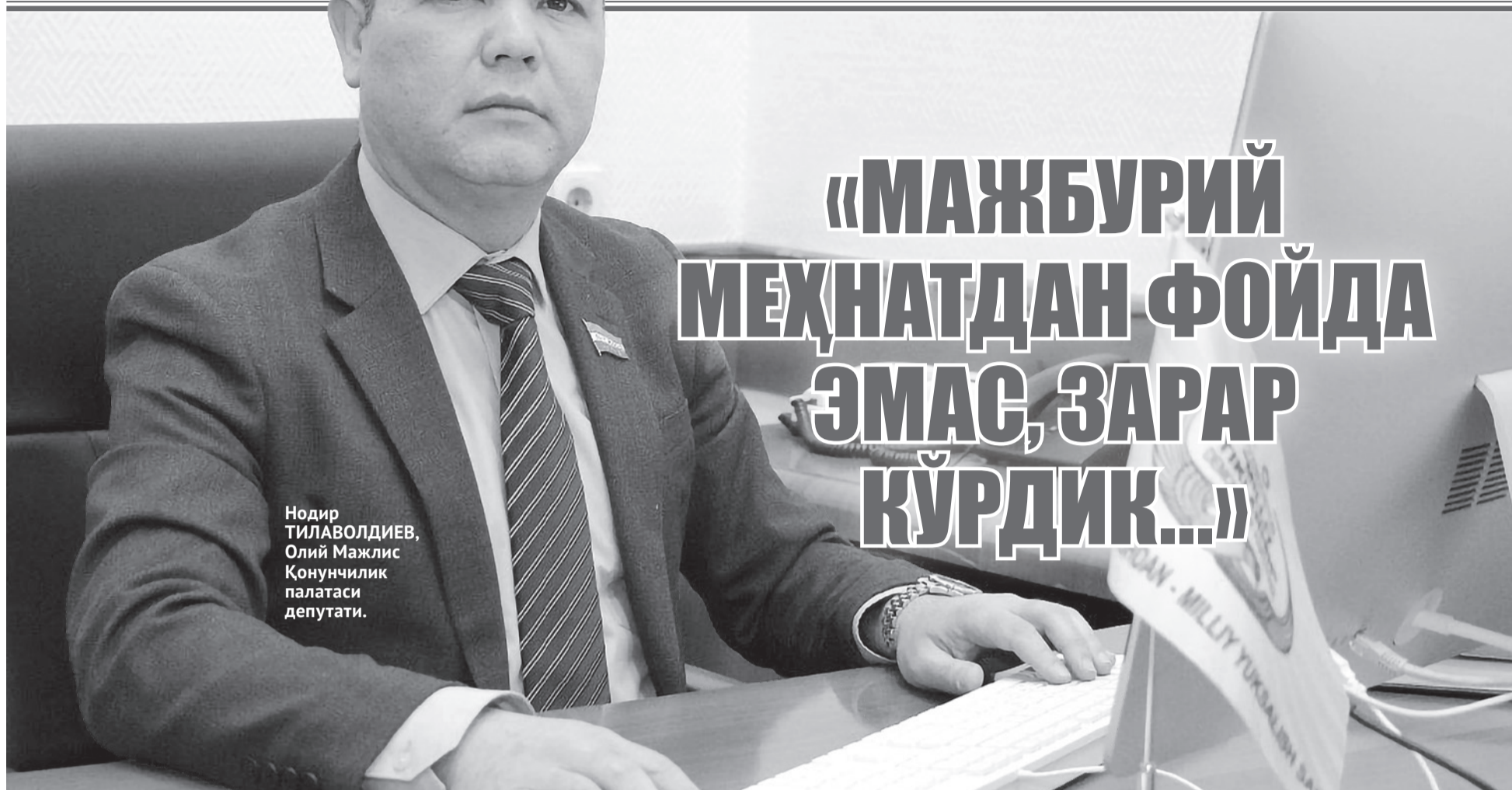
Нодир ТИЛАВОЛДИЕВ, Олий Мажлис Қонунчилик палатаси депутати.