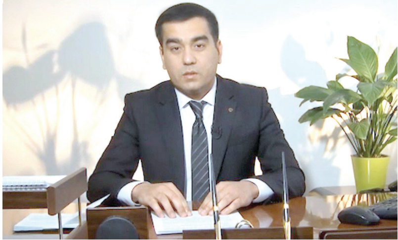
Умид ГИЙСОВ, Ўзбекистон Республикаси Конституциявий судининг катта эксперти

Демократиянинг асосий шаклларида бири — давлат ва жамият ҳаётидаги муҳим масалаларнинг умумхалқ муҳокамасида ўз ечимини топиши референдум ҳисобланади.