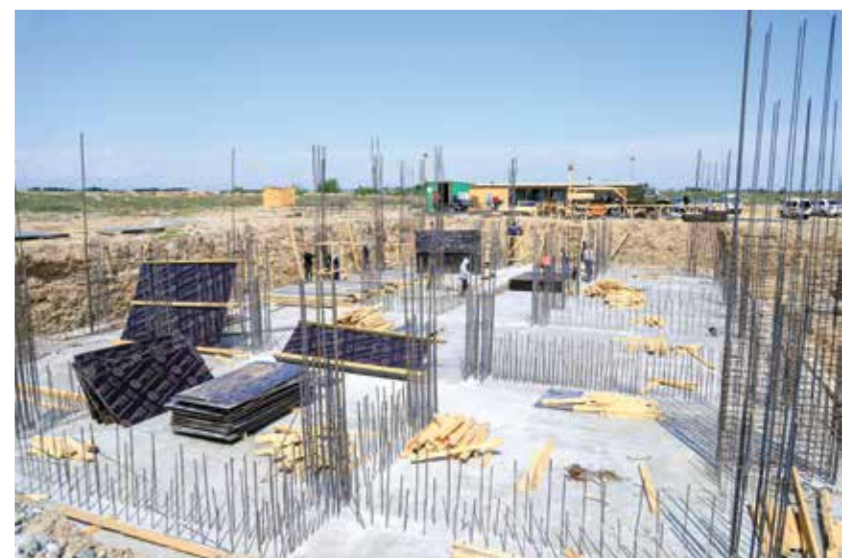
Суратларда: Наманган вилояти Давлатобод туманидаги Янги Наманган шаҳарчасида қурилиш ишлари жадал давом этмоқда.