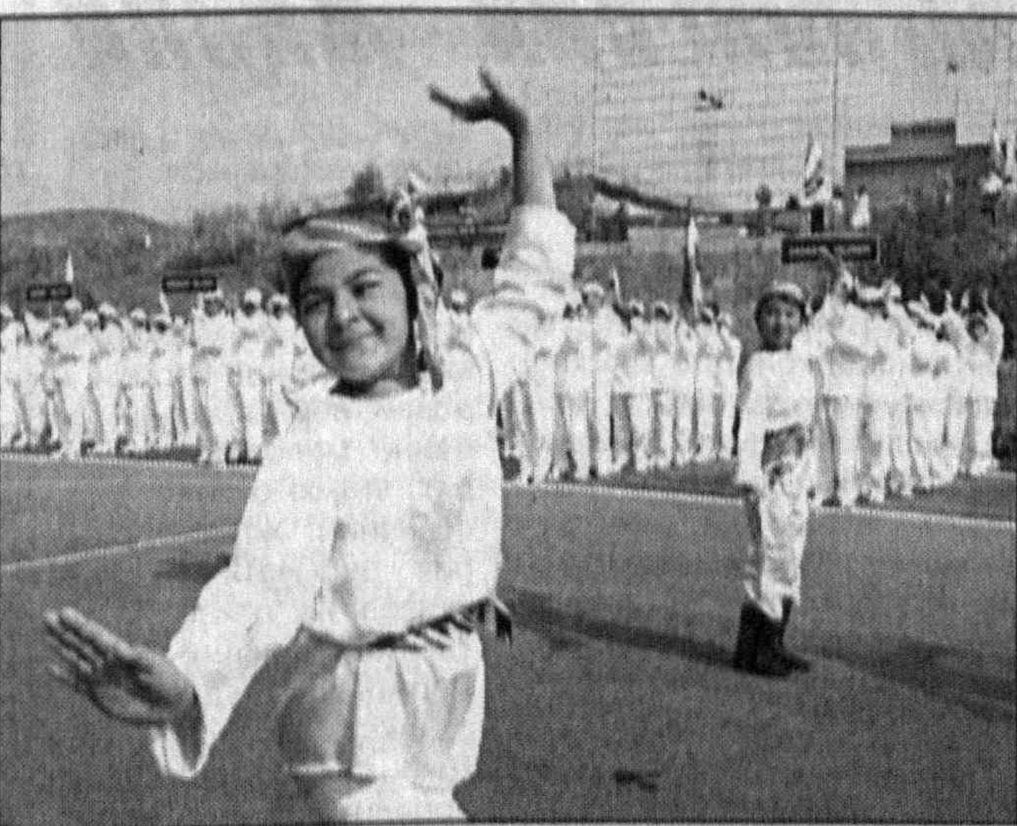
На снимках: в составе сборной команды нашей области спортсмены, которые способны бороться за медали самой высокой пробы; зажженный от солнечных лучей в Паркенте факел соревнований прибыл в Карши; церемония открытия соревнований «Умид нихоллари-2006» превратилась в яркий праздник.