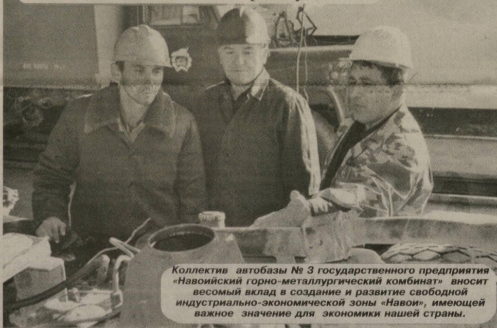
Коллектив автобазы № 3 государственного предприятия «Навоийский горно-металлургический комбинат» вносит весомый вклад в создание и развитие свободной индустриально-экономической зоны «Навои», имеющей важное значение для экономики нашей страны.

Более ста единиц различной техники, в том числе самосвалы, автокраны, подъемники, водовозы, автобусы были задействованы подразделением комбината на строительстве первичных объектов СИЭЗ. Опытные водители своевременно обеспечивали доставку туда специалистов и строительных материалов. Весь автотранспорт работал без каких-либо сбоев.