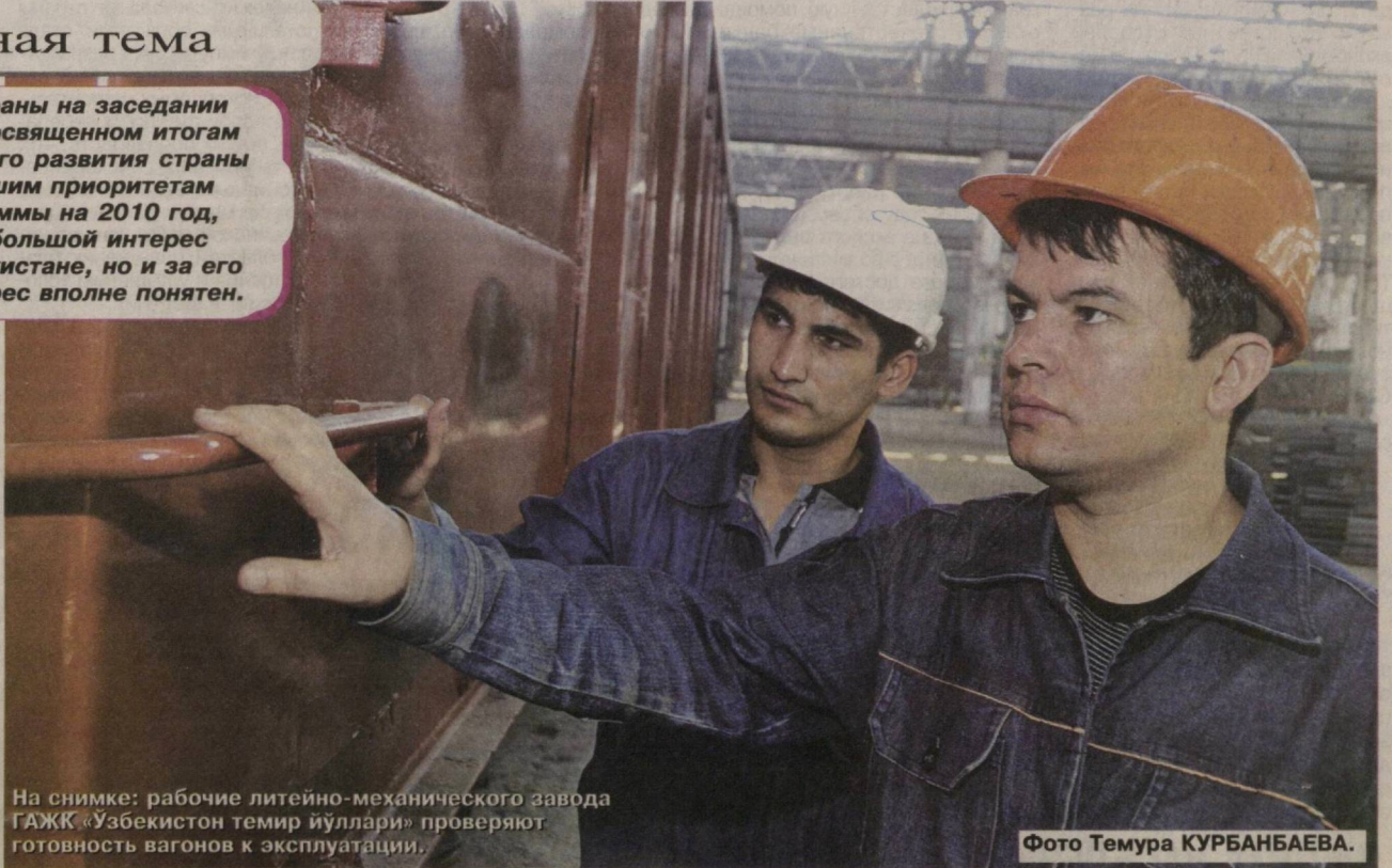
На снимке: рабочие литейно-механического завода ГАЗК «Узбекистон темир йуллари» проверяют готовность вагонов к эксплуатации.

В рамках газетной публикации, конечно же, невозможно рассказать обо всех предпринятых руководством Узбекистана антикризисных мерах, позволивших продолжить устойчивое социально-экономическое развитие страны, достичь, в частности, по итогам 2009 года прироста ВВП на