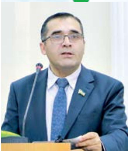
Кодир ЖўРАЕВ, Олий Мажлис Қонунчилик палатаси Халқаро ишлар ва парламентлараро алоқалар қўмитаси раиси ўринбосари