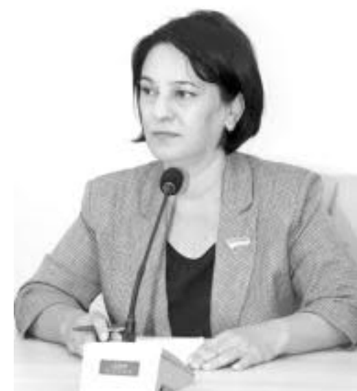
Дилбар МАМАЖОНОВА, Олий Мажлис Қонунчилик палатаси депутати:

— Халқаро меҳнат ташкилоти маълумотига кўра, бугунги кунда 218 миллион нафар бола мажбурий меҳнат қурбонидир. Шундан 89 миллион нафари хавфли ва зарарли ишларда меҳнат қилмоқда.