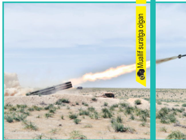
Muallif suratga olgan