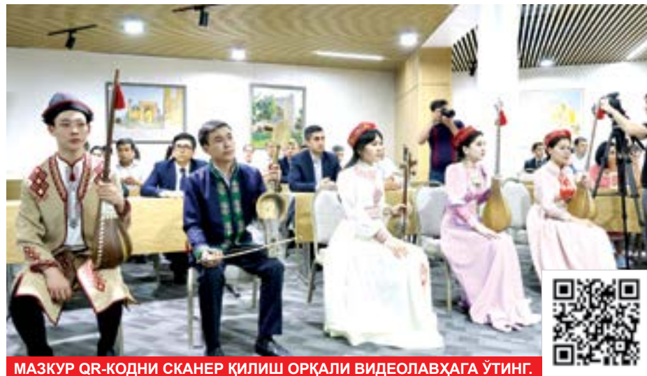
МАЗКУР QR-КОДНИ СКАНЕР ҚИЛИШ ОРҚАЛИ ВИДЕОЛАВҲАГА ЎТИНГ.