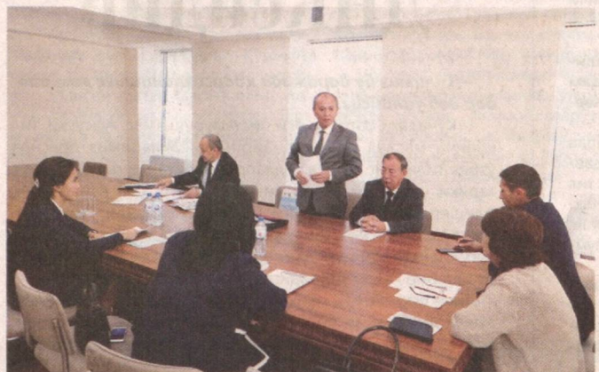
Ахшоб ГҲЯЯ олинган суратлар