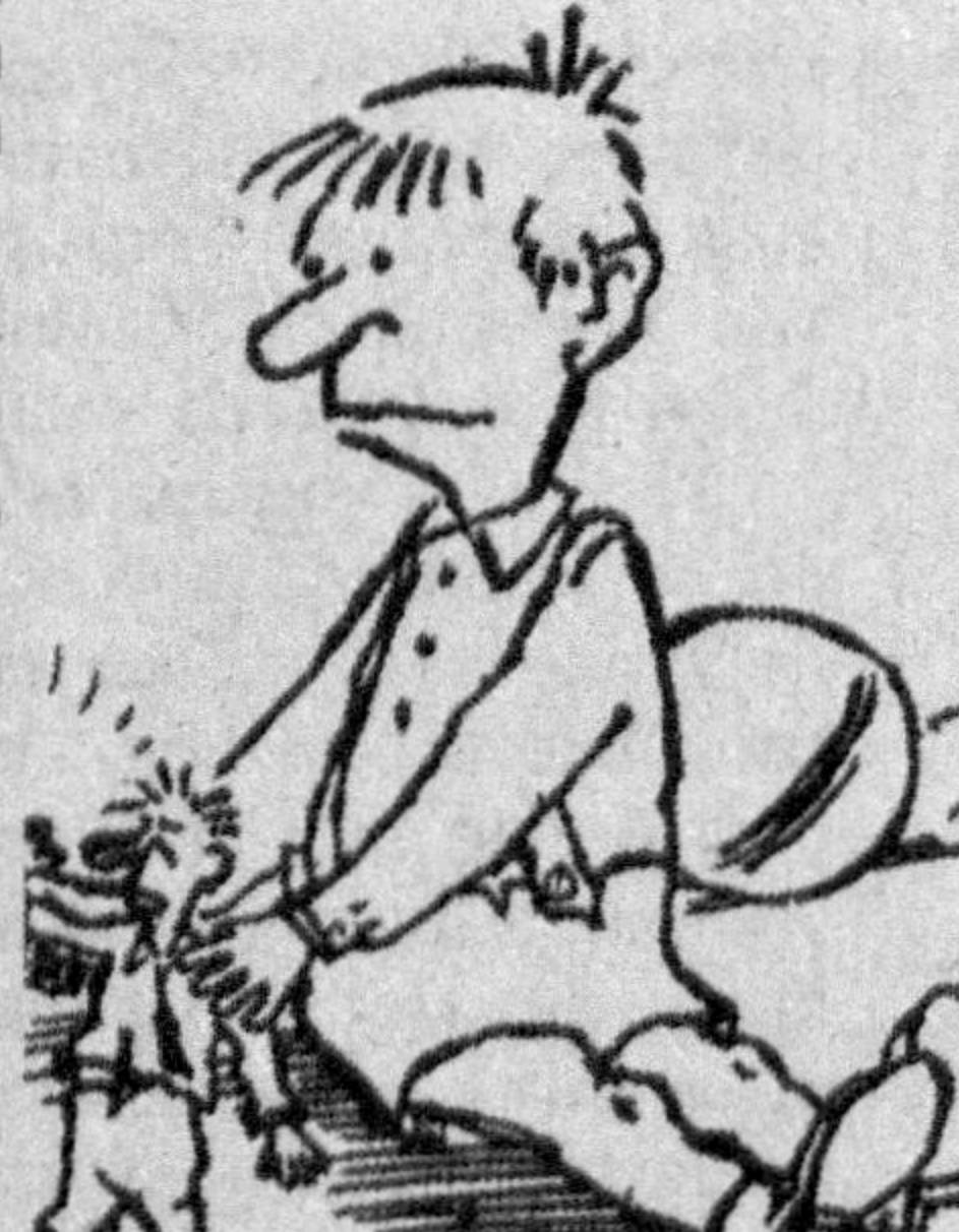
(По материалам средств массовой информации).

Когда Уолт Дисней был ребенком, он замучил сову. С тех пор он решил оживить животных в мультфильмах. Английская писательница Вирджиния Вульф написала большинство своих книг стенографически. Сара Бернар сыграла 13-летнюю Джульетту в 70 лет. Юлий Цезарь носил лагерь в войсках, чтобы скрыть появившуюся лысину. Александр Белл, изобретатель телефона, ни разу не позвонил своим маме и жене: они обе были глухими. Леонардо да Винчи изобрел будильник, который тер спящую ногу. Нос растет в течение всей жизни человека. Белковые бороды растут быстрее, чем темные. Когда вы краснеете, ваш желудок краснеет тоже. 80 процентов тепла человеческого тела уходит из головы. На теле одного человека живет больше живых организмов, чем людей на Земле. Один волос может выдержать вес в 3 килограмма. Зоопарк в Токио каждый год закрывается на 2 месяца, чтобы звери могли отдохнуть от посетителей. Несмотря на горб, позвоночник у верблюда прямой. Собаки женского пола кусают чаще, чем псы.