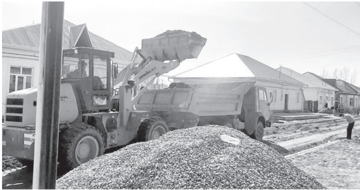
◀ (Окончание. Начало на 1-й стр.)

Радость и удовлетворенность населения выражаются не только словами благодарности, но и настроением.