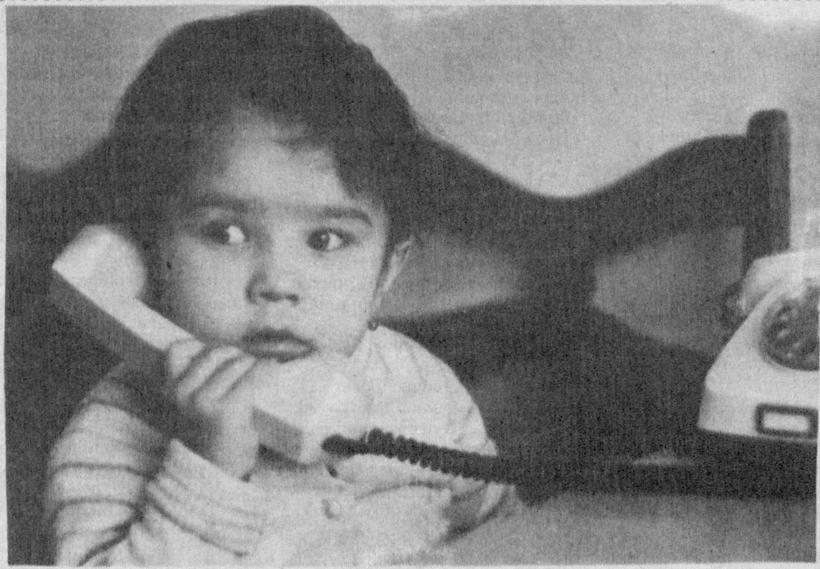
Алло, далажон, қачон келасиз?