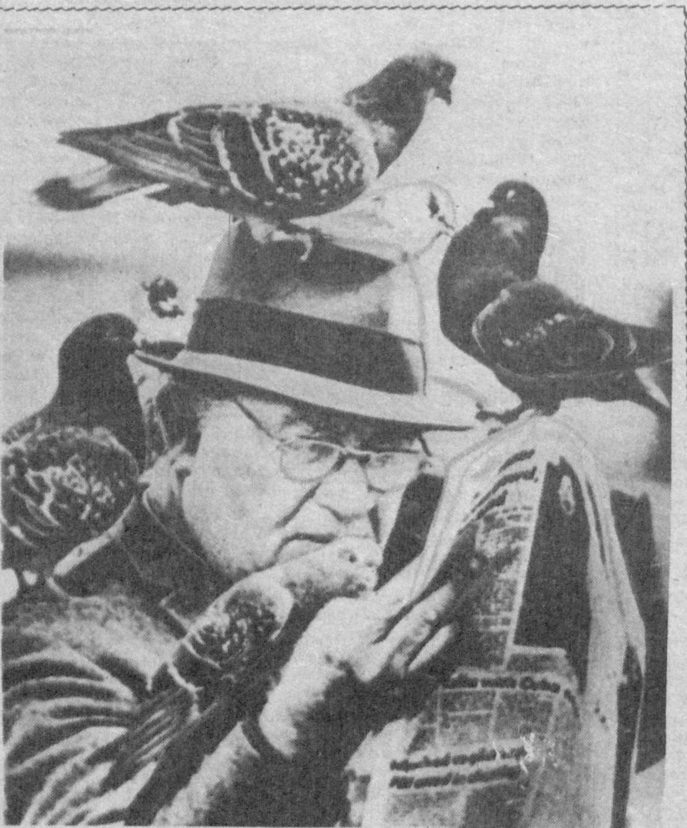
Изоҳни ўзингиз топинг.