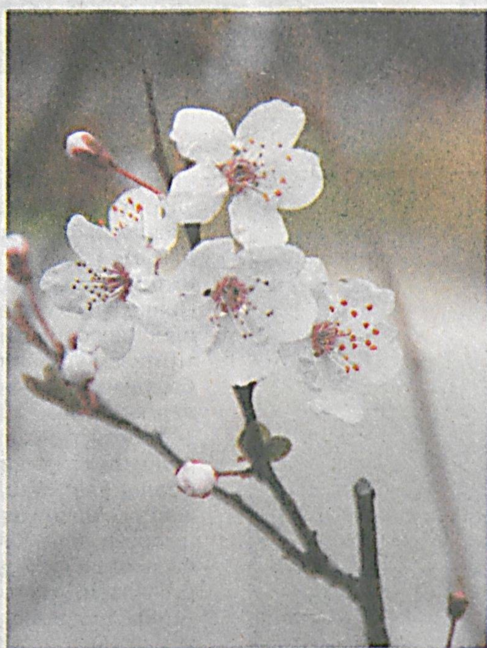
кунларни сева-сева ўзи ҳам катта муҳаббатнинг бир қисмига айланади. Обод ва фаровон ҳаёт сари дадил интилаётган юртдошларимизнинг қалби оппоқ орзуларга тўла. Зеро, Баҳор ва Наврўз ҳаёт абадийлигининг тантанасидир.