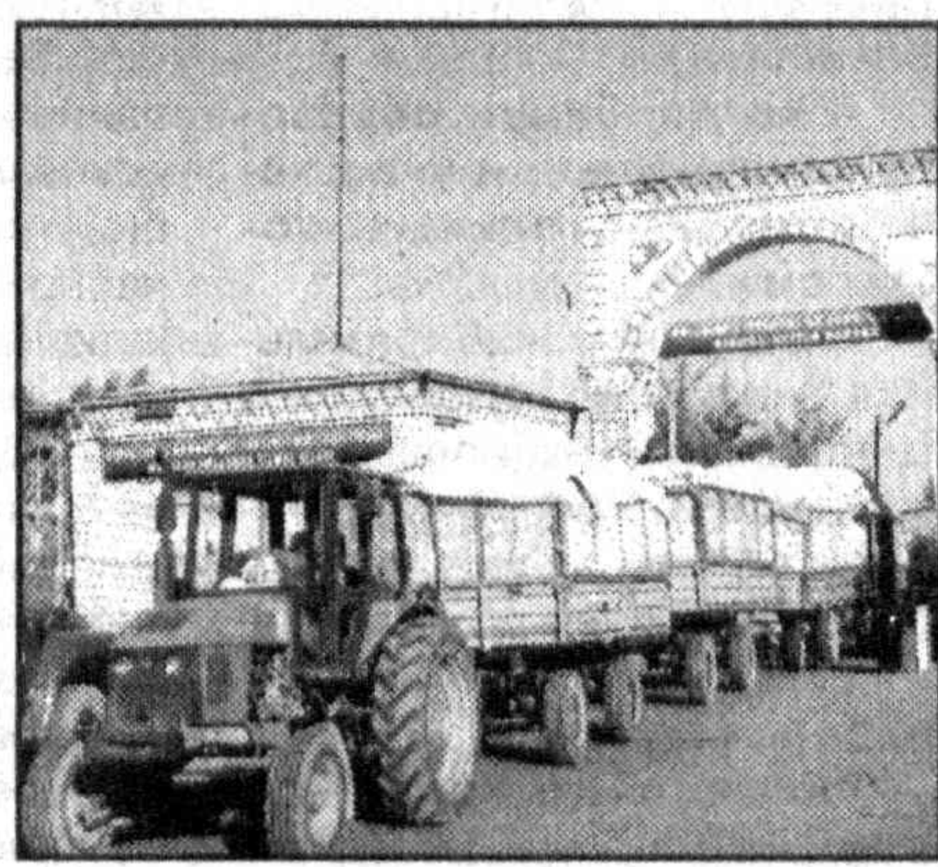
внизу - механизатор Шарифджон Абдуллаев.

На снимках: слева - фермер Алибек Абдухаликов; сверху - доставка собранного урожая на хлопкоперерабатывающее предприятие;