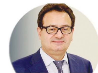
Дар суҳанронии худ Президенти Ўзбекистон вазифаҳои аввалиндараҷаро бинобар ҳам-