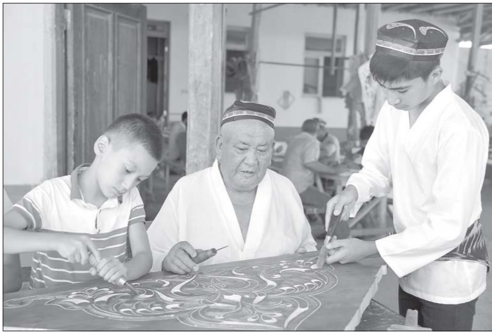
Дар ҳокимияти вилояти Фарғона соли 2022 барои дар тўли солҳои 2022-2024 ба амал таъбиқ намудани Стратегияи рушди хунармандӣ мувофиқи «харитаи амалиёт» корҳои зиёде иҷро шуданд. Ба хусус ба лоиҳаҳои 914 нафар хунарманде, ки меҳонад, ки сифати субъекти соҳибкорӣ нав ба кор оғоз кунанд, аз ҷониби «Бонки халқӣ», «Микрокредитбанк» ва «Агробанк» ба андозаи 35,4 миллиард сўм маблағи воми имтиёзон ҷудо карда, 4225 ҷойҳои нави корӣ кушода шуданд. Соли 2023-юм бошад, дар ноҳияи Риштон 4 адад «Маркази хунармандӣ»-и ба кулоли маҳсусонидошуда, дар шаҳри Марғилон «Мақтаби мисғарӣ ва қандакорӣ», дар шаҳри Қўқанд «Осорхонаи миллии хунармандӣ ва маркази сайёҳӣ» бояд таъбиқ карда шаванд.