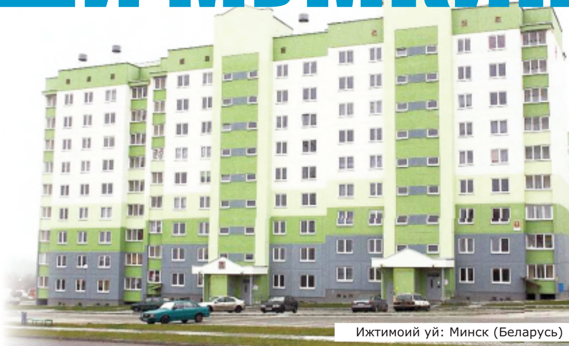
Ижтимоий уй: Минск (Беларусь)

ТОШКЕНТ. ВАТАНИМИЗ ПОЙТАХТИ БЎЛГАН БУ БОШ ШАҲАР НАФАҚАТ ЎЗ ГЎЗАЛЛИГИ, ЧИРОЙИ БИЛАН МАФТУН ЭТГАН, БАЛКИ ИМКОНИАТЛАРИ БИЛАН ҲАМ ОДАМЛАРНИ ОҲАНРАБОДАЙ ЎЗИГА ЧОРЛАБ КЕЛАДИ. ШУНДАН БЎЛСА, ҲАМИША КЎЧАЛАР ГАВЖУМ, ШОВҚИНЛИ. ДОИМ КИМДИР ҚАЁҚҚАДИР ШОШГАН, НИМА БИЛАНДИР БАНД. УМУМАН, ШАҲАР ТУНУ КУН ҲАРАКАТДА.