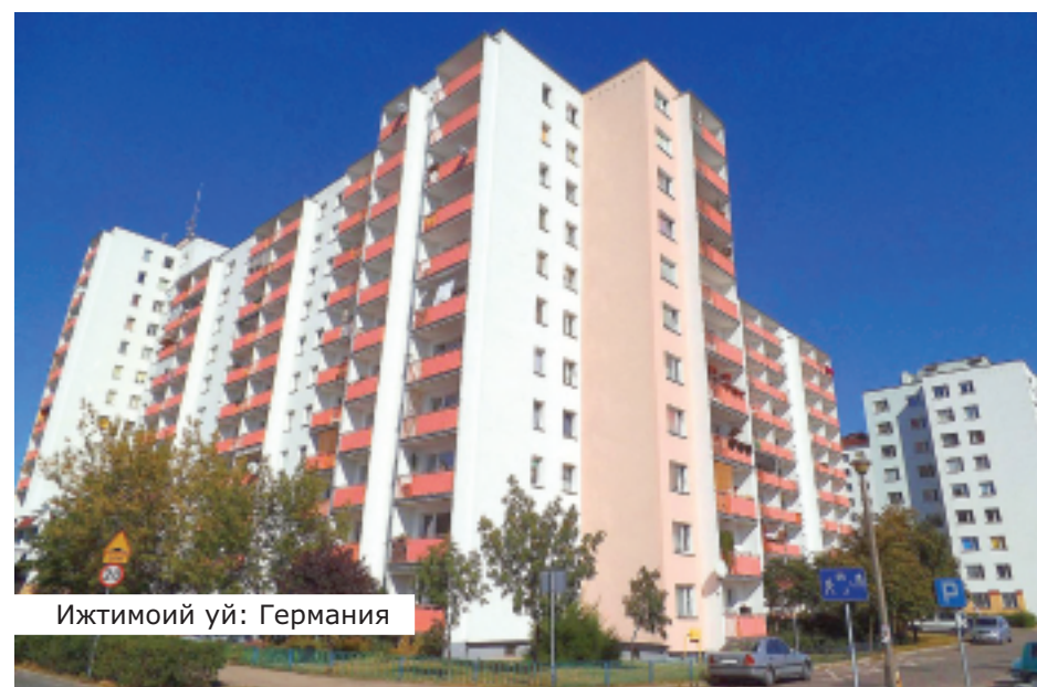
Ижтимоий уй: Германия

Беларусь республикаси Уй-жой кодексига кўра, ижтимоий фойдаланиш учун мўлжалланган