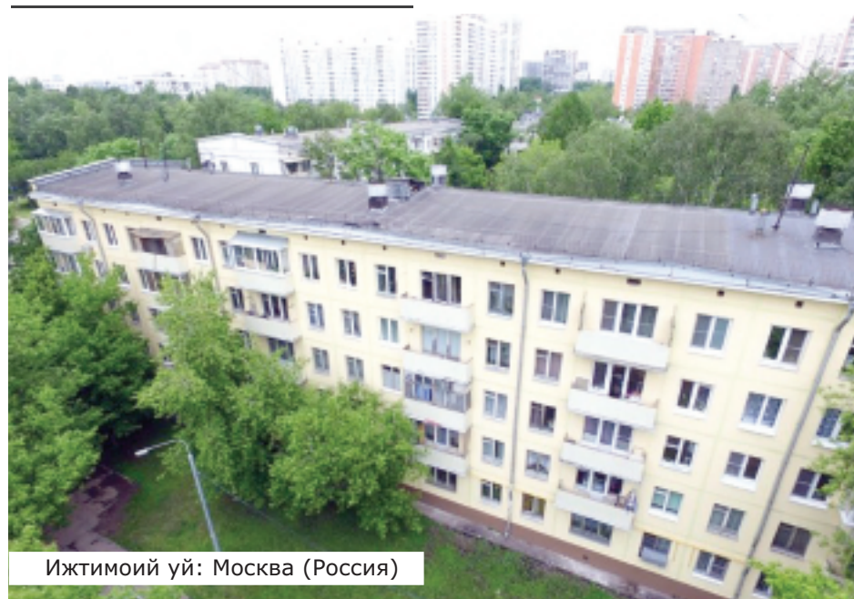
Ижтимоий уй: Москва (Россия)

Яна бир жиҳати, ижарада турувчилар ушбу ижара уйлари фойдаланишга топширган тижорат банкларида ўз ҳисоб рақамларини очишади ва ушбу