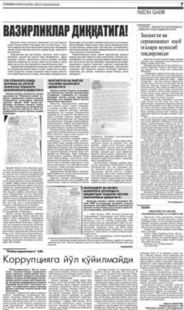
Коррупцияга йўл қўйилмайди

"...Ўзбекистон Республикаси "Жисмоний ва юридик шахсларнинг муурожаатлари тўғрисида"ги Қонуни (кейинги ўринларда – Қонун)нинг 3-моддасида "жисмоний шахснинг фамилияси (исми, отасининг исми), унинг яшаш жойи тўғрисидаги маълумотлар ёки юридик шахснинг тўлиқ